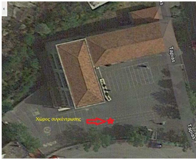
Β: Σχέδιο εκκένωσης 5 ου Νηπιαγωγείου Τρίπολης