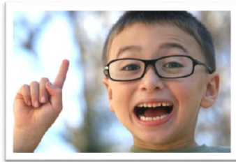
Υπόδειξη με σαφήνεια & συντομία

Σιγουρευτείτε ότι η εντολή που δίνετε στο παιδί σας γίνεται κατανοητή από το ίδιο. Προσπαθήστε να είστε σύντομοι και σαφείς και μη διστάσετε να επαναλάβετε την εντολή αρκετές φορές αν χρειαστεί, με διαφορετικά λόγια εάν το παιδί δείχνει να μην καταλαβαίνει.