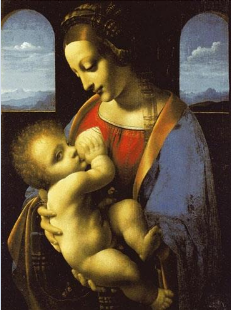
Λεονάρντο Ντα Βίντσι