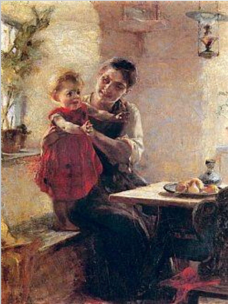
Κάνουμε τα πρώτα βήματα