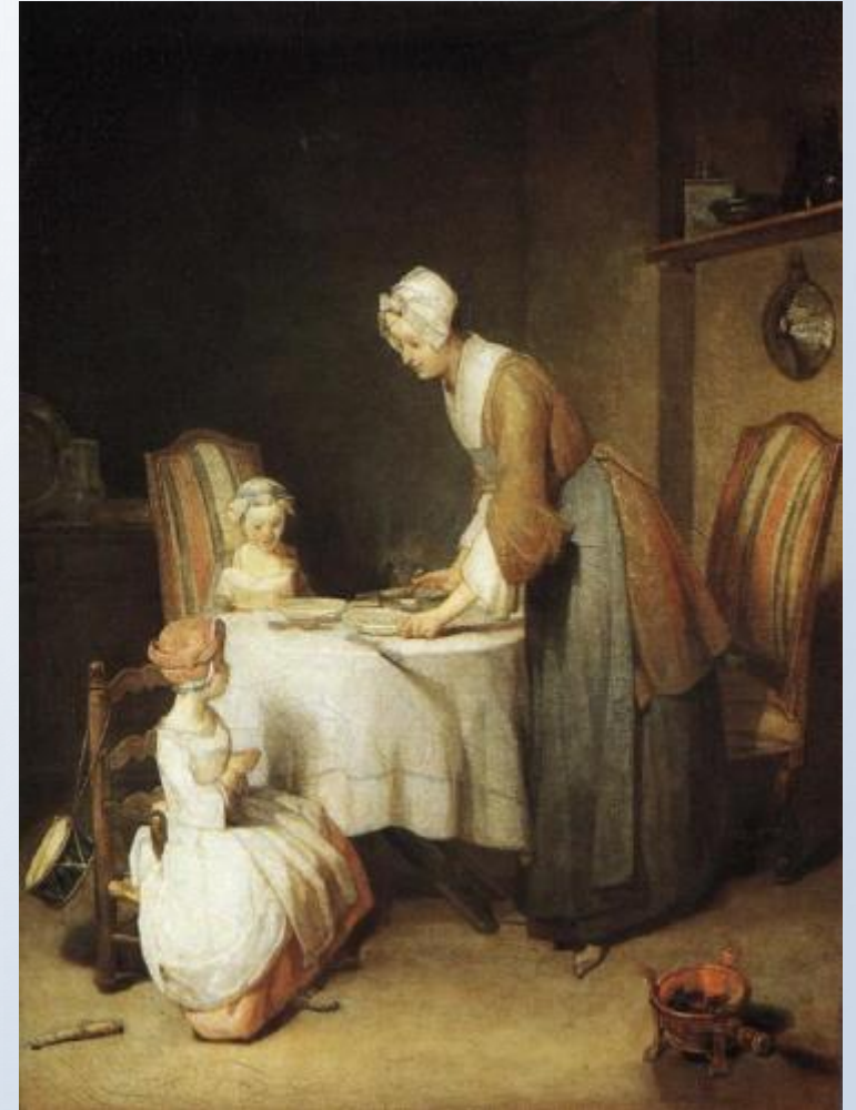
Jean Simeon Chardin