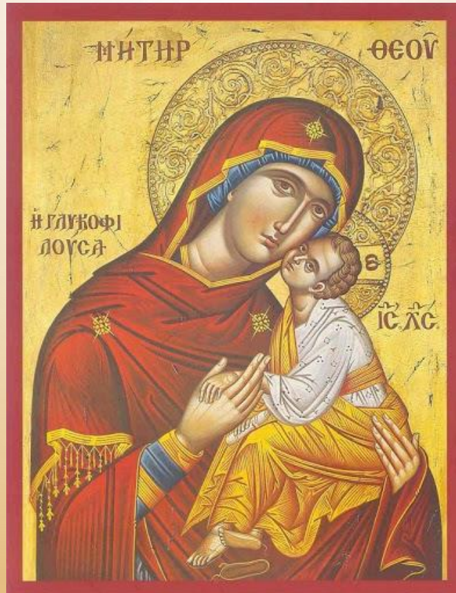
Παναγία η γλυκοφιλούσα