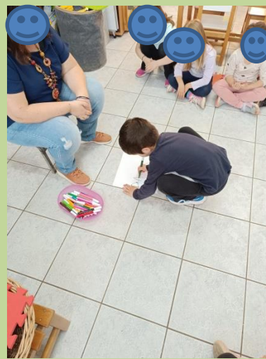
Τα παιδιά γράφουν τη λέξη δάσος

Τις ιδέες μας τις καταγράφουμε και δημιουργείται το παρακάτω ιστόγραμμα: