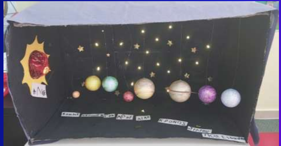
3D απεικονίσεις του ηλιακού συστήματος