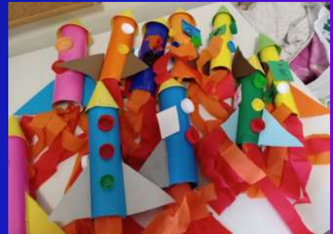
Πύραυλοι έτοιμοι για απογείωση!