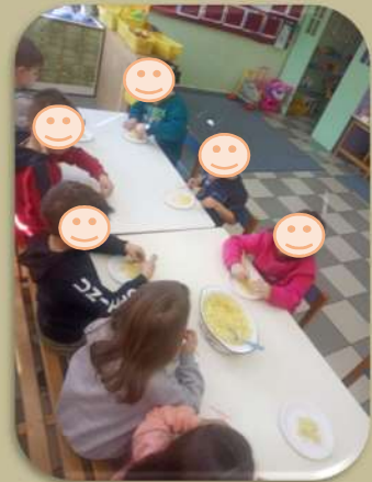
Αλλά τρώμε πιο καλά με κουτάλια.