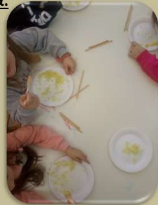
Και με πράσινο τσάι από την Κίνα....στην υγεία μας.