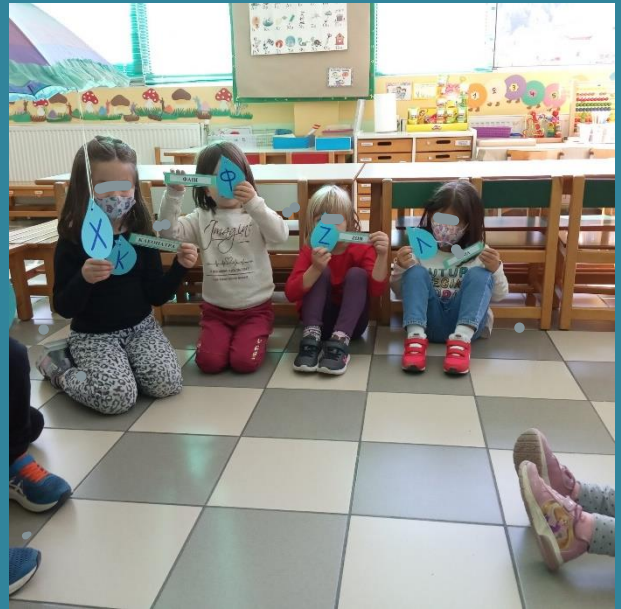
Φύλλα εργασίας με το αρχικό γράμμα του ονόματος του κάθε παιδιού.