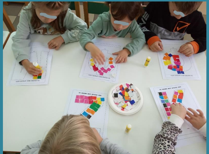
Φύλλα εργασίας για την αναγνώριση των γραμμάτων των ονομάτων τους.