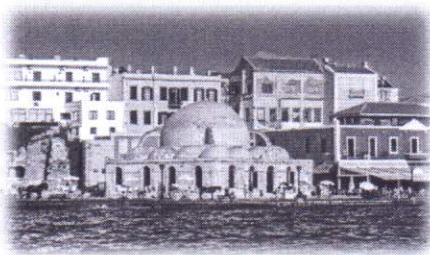
Χανιά - Παλιό Λιμάνι