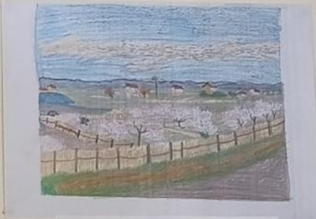
Ανθισμένες ροδακινιές στο Λα Κρο 1889