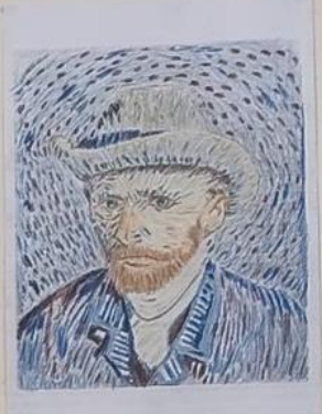
Αυτοπροσωπογραφία με γκρι καπέλο από τοόχα 1887