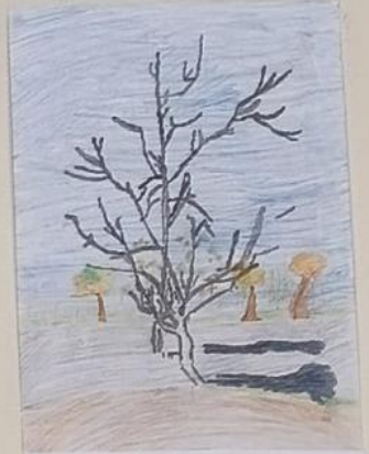
Ανθισμένες ροδακινιές 1888