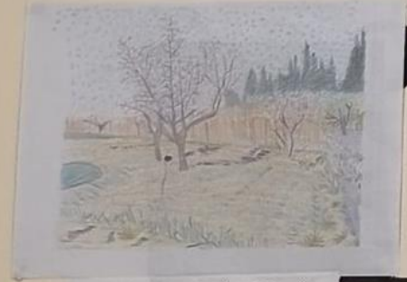
Δενδρόκηπος με ανθισμένες ροδακινιές 1888