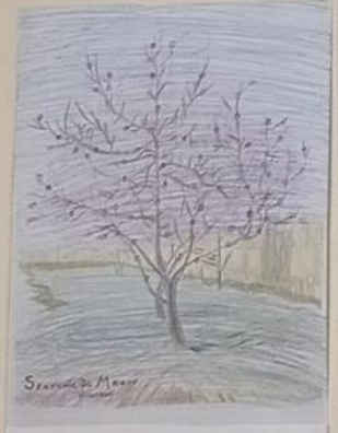
Ανθισμένη ροδακινιά (Souvenir de Mauve) 1888