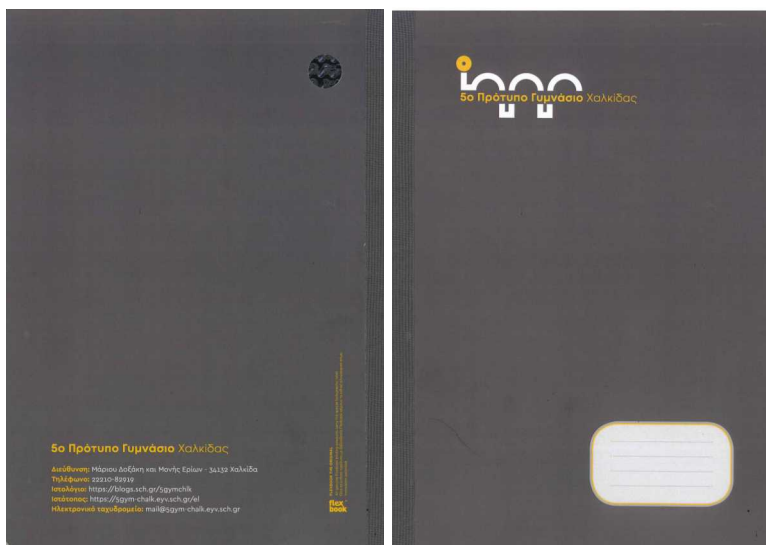
Τετράδια Σημειώσεων A4, τεχνολογίας Flexbook