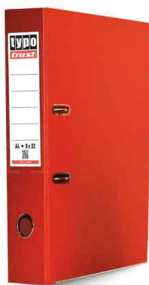
Κλασέρ από χαρτόνι 8/32