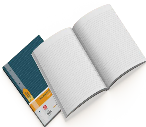
Ανταλλακτικά φύλλα με ενισχυμένη ταινία A4