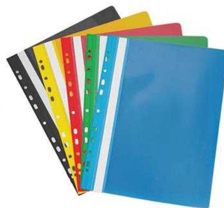
Ντοσιέ πλαστικό έλασμα A4 με τρύπες για αρχειοθέτηση