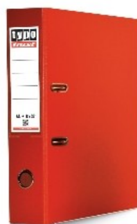
Κλασέρ από χαρτόνι 8/32