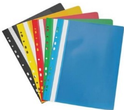
Ντοσιέ με έλασμα Α4 με τρύπες για αρχειοθέτηση