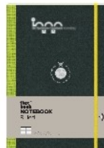
Notebook Ruled Large Red 4 - Μέγεθος A4 με τυπωμένο το λογότυπο του σχολείου