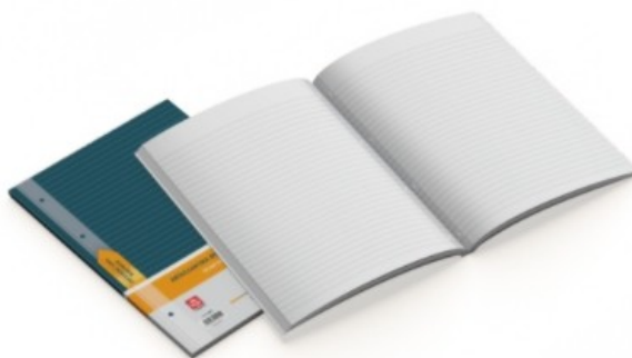
Ανταλλακτικά φύλλα με ενισχυμένη ταινία Α4