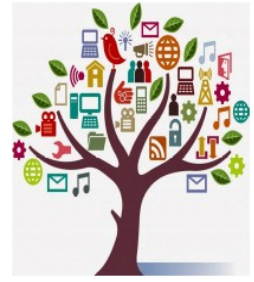
ΣΥΝΔΕΣΗ ΜΕ ΤΗΝ ΤΟΠΙΚΗ ΚΟΙΝΩΝΙΑ