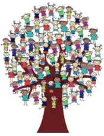
ΣΥΜΠΕΡΙΛΗΨΗ ΚΑΙ ΔΕΞΙΟΤΗΤΕΣ ΖΩΗΣ