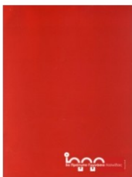
Τετράδιο ραφτό Α4 150 σελίδες για πρόχειρο

Οι μαθητές και οι μαθήτριες θα έχουν στο σακίδιό τους καθημερινά ένα Τετράδιο Σημειώσεων (ραφτό όχι σπιδάλ) μεγέθους Α4 με 150 φύλλα που στο εξής θα ονομάζουμε ΠΡΟΧΕΙΡΟ , όπου θα κρατούν σημειώσεις, κάθε ώρα, σε κάθε μάθημα σημειώνοντας ημερομηνία, ώρα και ονομασία μαθήματος και θα καταγράφουν όσα παραδίδουν οι εκπαιδευτικοί στην τάξη και θεωρούνται σημαντικά. Το να κρατάνε σημειώσεις, να ξεχωρίζουν το ουσιώδες από το επουσιώδες την στιγμή που το προσλαμβάνουν προφορικά στην τάξη, είναι μια απαραίτητη δεξιότητα που κατακτάται με καθημερινή άσκηση. Απαιτεί εγρήγορση και κρίση που ασκείται σε κάθε ώρα κατά τη διάρκεια του ωρολογίου προγράμματος. Για τις εργασίες – ασκήσεις που τους ανατίθενται στο σπίτι, σε όλα τα μαθήματα, οι μαθητές και οι μαθήτριες θα χρησιμοποιούν Α4 λυτά φύλλα με γραμμές και τρύπες. Στο σχολείο, την ορισμένη από τον εκπαιδευτικό ημέρα, θα προσκομίζουν μόνο το φύλλο με την εργασία. Μετά τον έλεγχο και τη διόρθωση από τον εκπαιδευτικό θα το παραλαμβάνουν και κατόπιν στο σπίτι θα το αρχειοθετούν σε έναν λεπτό φάκελλο ανά μάθημα. Ο φάκελλος κάθε μαθήματος, με όλες τις εργασίες του μήνα, θα ελέγχεται μηνιαίως από τον εκπαιδευτικό.