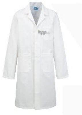
Ρόμπα-Ποδιά Εργαστηρίου Λευκή με το λογότυπο του σχολείου

Ο Σύλλογος γονέων και κηδεμόνων, συμπαραστάτης και οδηγός στην προσπάθεια του 5ου Προτύπου Γυμνασίου Χαλκίδας έχει εξασφαλίσει σημαντικές εκπτώσεις για ομαδική παραγγελία 1) γεωγραφικού άτλαντα 2) ρομπών-ποδιών για τα εργαστήρια φυσικών επιστημών με το λογότυπο του σχολείου, και 3) τετραδίου σημειώσεων flexbook με το λογότυπο του σχολείου. Σύντομα το Δ.Σ του Συλλόγου Γονέων και Κηδεμόνων θα επικοινωνήσει μαζί σας για να σας προτείνει τη σχετική παραγγελία.