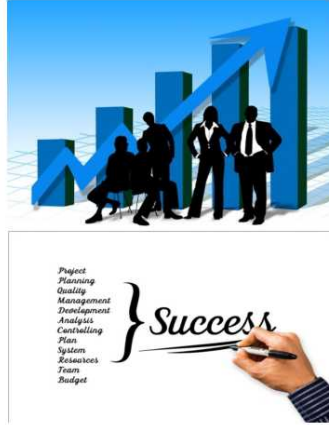
Όμιλος Συμβουλευτικής Σταδιοδρομίας : Οι επιτυχημένοι εργαζόμενοι του μέλλοντος

Οι μαθητές/τριες του 5ου Προτύπου Γυμνασίου Χαλκίδας, του 1 ου Προτύπου ΓΕΛ Χαλκίδας και του 4 ου ΓΕΛ Χαλκίδας, στα πλαίσια δραστηριοτήτων του Ομίλου Συμβουλευτικής Σταδιοδρομίας με θέμα: « Σχεδιάζοντας το Επαγγελματικό μου μέλλον με έμφαση στο Επιχειρείν », εκτός των άλλων δράσεων, μυήθηκαν για πρώτη φορά στα μυστικά της Κβαντικής Υπολογιστικής, μετατρέποντας ψηφιακά κβαντικά παίγνια σε επιτραπέζια κβαντικά παίγνια. Η δραστηριότητα αυτή πραγματοποιήθηκε για πρώτη φορά στην Ελλάδα, στο πλαίσιο ενός project του Πανεπιστημίου της Οξφόρδης: μελέτη της δυνατότητας μεταφοράς, ανάλυσης και προβολής ανώτερων μαθηματικών και φυσικών εννοιών σε μαθητές/τριες δευτεροβάθμιας εκπαίδευσης με απλό τρόπο.