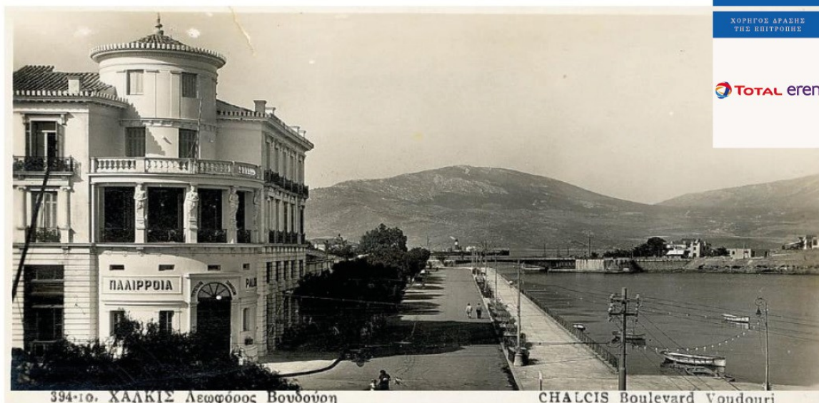
394-10. ΧΑΛΚΙΣ Λεωφόρος Βουδούρη