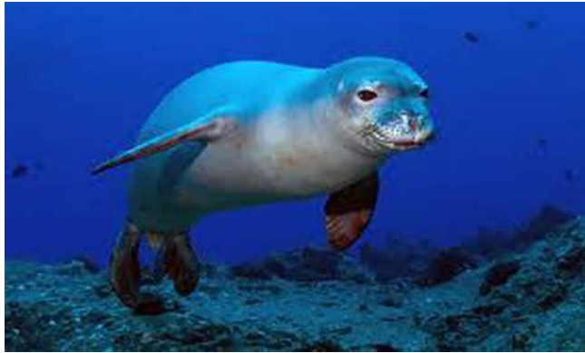
Η φώκια Μονάχους

Αγαπητή μου φώκια Μονάχους, Χτες μόλις έμαθα ότι υπάρχουν, ότι σε λένε Μονάχους κι ότι είσαι από τα σπάνια είδη που ζουν στις ελληνικές θάλασσες. Το έμαθα από την τηλεόραση. Ομολογώ ότι γοητεύτηκα μαζί σου. Σε είδα να κάθεσαι ακίνητη, σαν μαγεμένη, πάνω στα βράχια και ν' ακούς τους ψαράδες να τραγουδούν θαλασρινούς καημούς. Έμαθα ακόμη ότι αγαπάς τις Βόρειες Σποράδες. Κάποιοι έχουν προτείνει να γίνουν τα νησιά που αγαπάς, ένα θαλασρινό πάρκο που να προστατεύεται, να έχεις κι εσύ ένα μέρος δικό σου, ένα σπίτι. Για όλα αυτά σου έγραψα. Ας γράψω, λέω, στη φίλη μου τη φώκια.