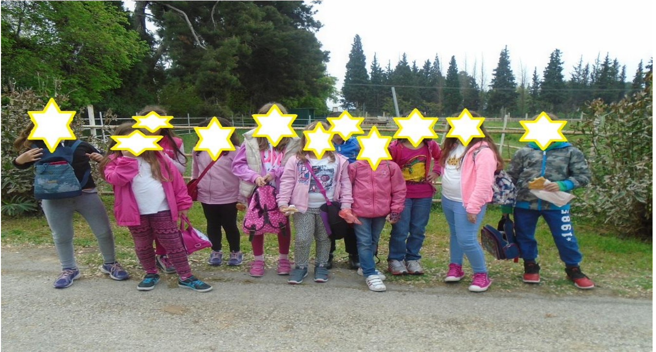
Και πάλι πίσω στο εργαστήριο των τεχνολόγων τροφίμων...