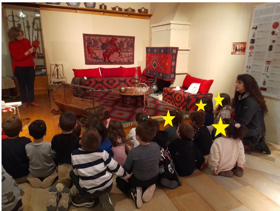
Παραδοσιακά υφαντά, πάντες, μαξιλιάρια, κεντήματα πλεχτά