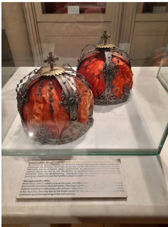
Γαμήλια στέφανα 18ου αι.