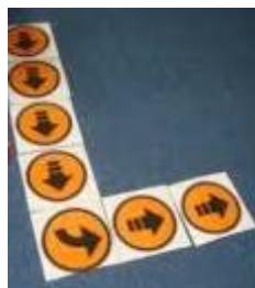
ΤΑ ΒΕΛΑΚΙΑ ΓΙΑ ΤΑ ΒΗΜΑΤΑ