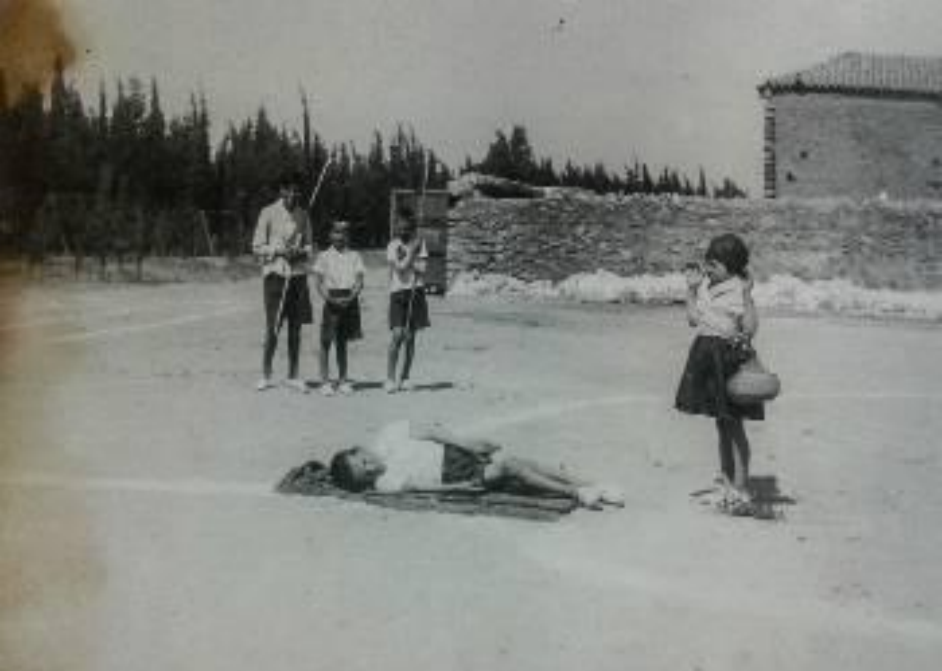
A HONOLULU BEACH