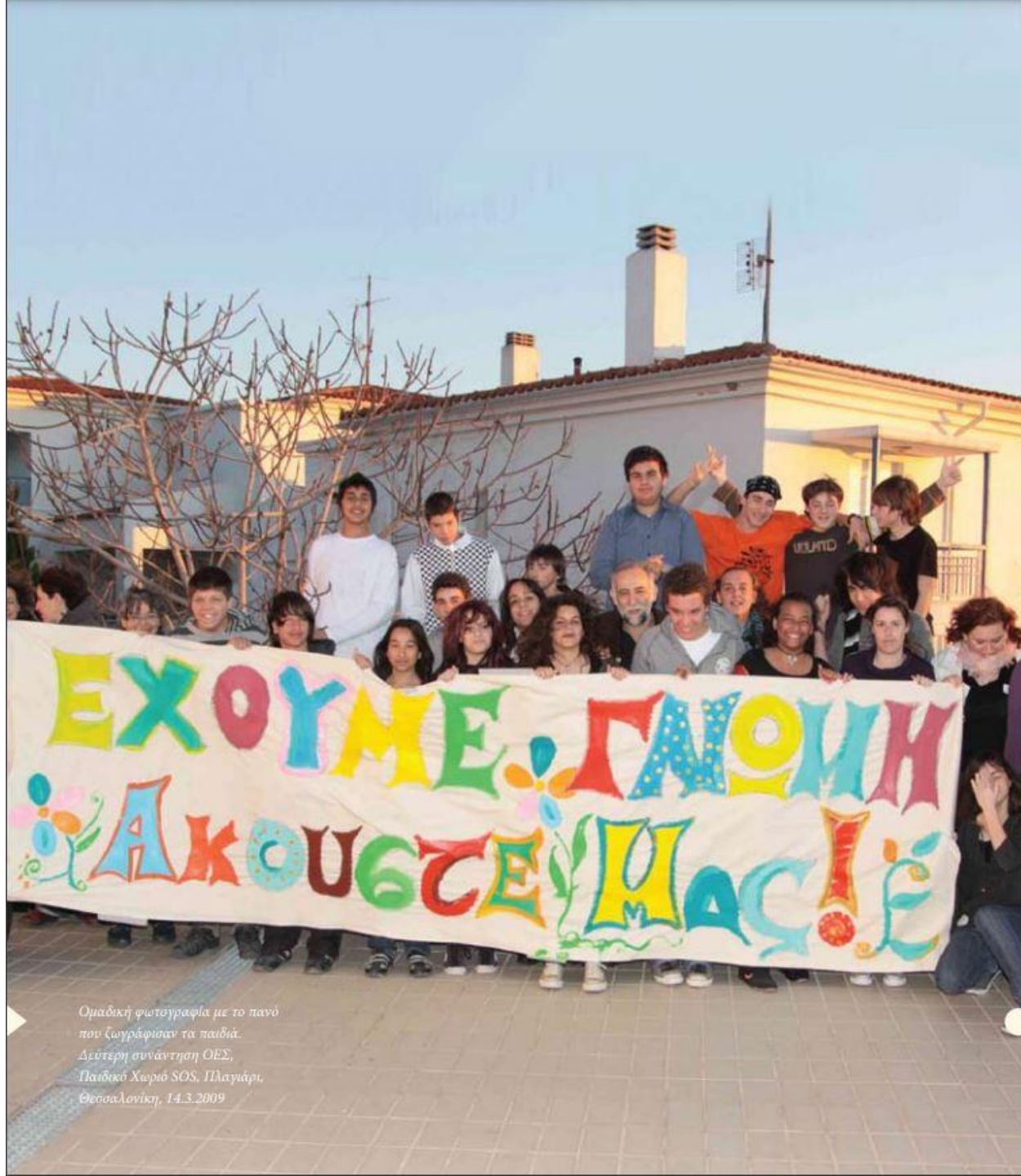
Ομαδική φωτογραφία με το πανό που ζωγράρισαν τα παιδιά. Δεύτερη συνάντηση ΟΕΣ, Παιδικό Χωριό SOS, Πλαγιάρι, Θεσσαλονίκη, 14.3.2009