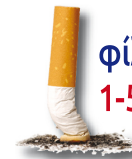
φίλτρο τσιγάρου 1-5 χρόνια