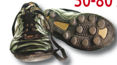
λαστικένια σόλα 50-80 χρόνια