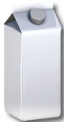
χάρτινη συσκευασία γάλακτος 3 μήνες