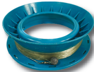
πετονιά 600 χρόνια