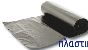
πλαστική σακούλα 10-20 χρόνια