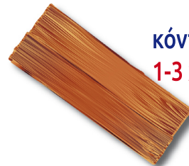
κόντρα πλακέ 1-3 χρόνια