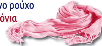
μάλλινο ρούχο 1-5 χρόνια