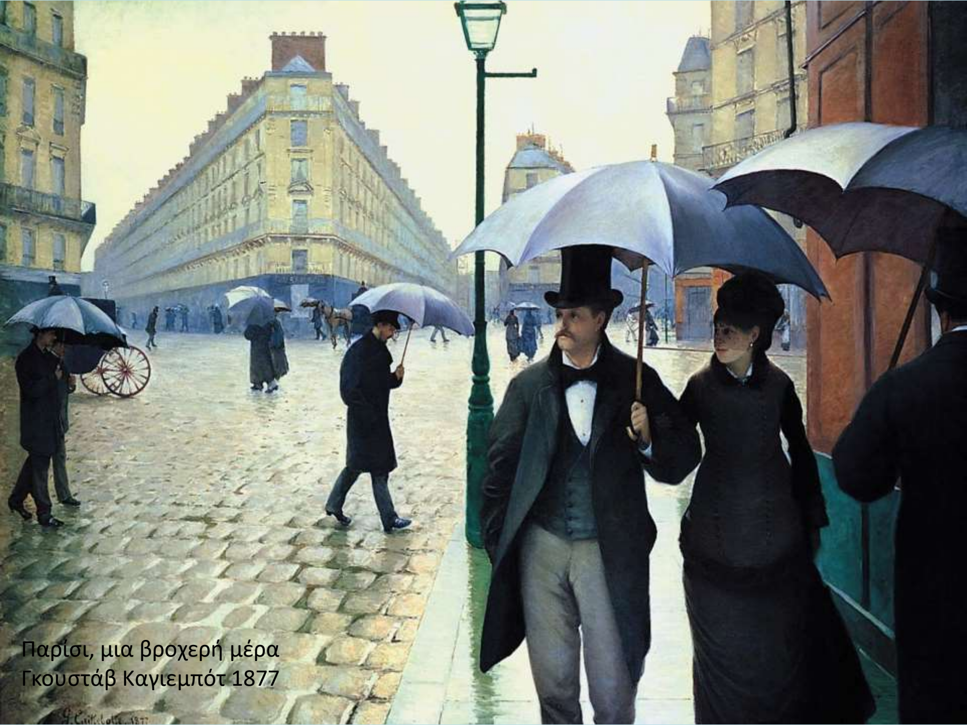
Παρίσι, μια βροχερή μέρα Γκουστάβ Καγιεμπότ 1877