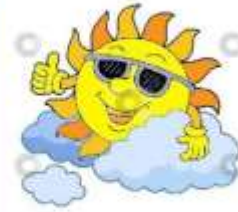
ΗΛΙΟΣ ΜΕ ΣΥΝΝΕΦΑ