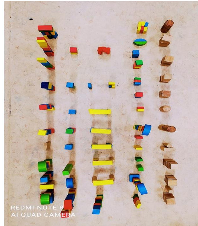
Αναπαράσταση του πίνακα ζωγραφικής του Mondrian με τίτλο «Broadway Boogie Woogie» (ομαδική εργασία της τάξης)