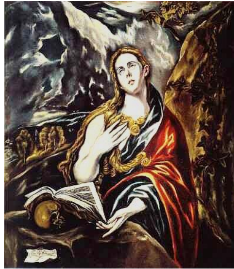
β) Δομίνικος Θεοτοκόπουλος, Η Μαγδαληνή