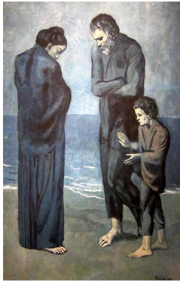
α) Πάμπλο Πικάσο, Η Τραγωδία (The Tragedy), 1903