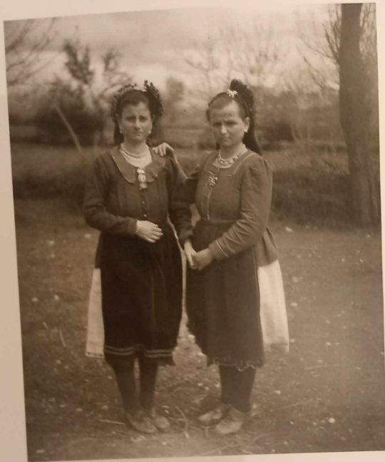
Λαοδομίστριες με παραδοσιακή ενδυμασία. Από το βιβλίο "Μυθολογία".