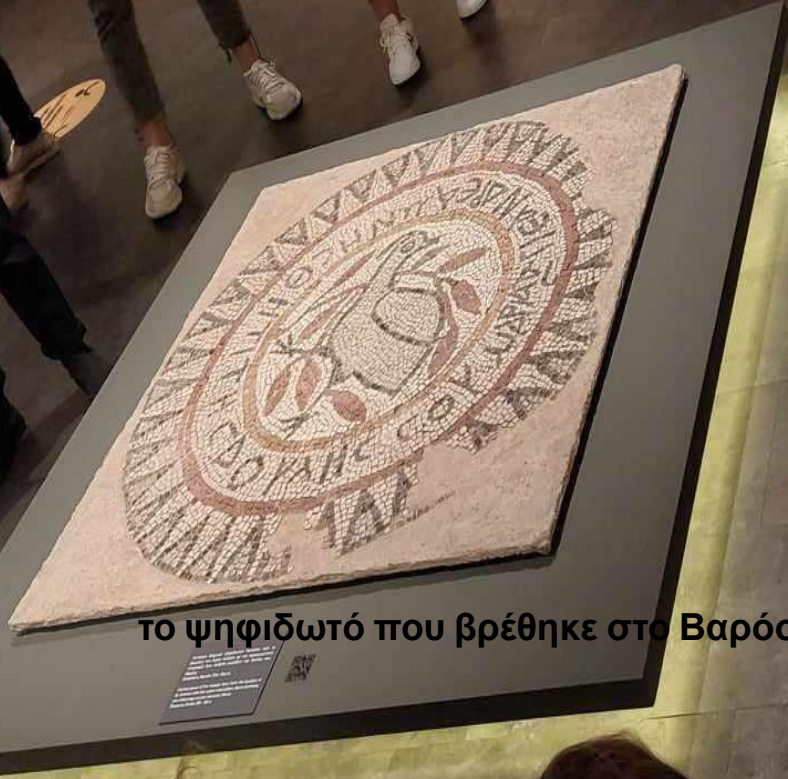
το ψηφιδωτό που βρέθηκε στο Βαρόσι Ελασσόνας

ΠΑΡΑΚΑΛΟΥΜΕ ΤΗΡΕΙΤΕ ΤΙΣ ΑΠΟΣΤΑΣΕΙΣ ΑΙΘΑΛΕΙΑΣ 2.00m