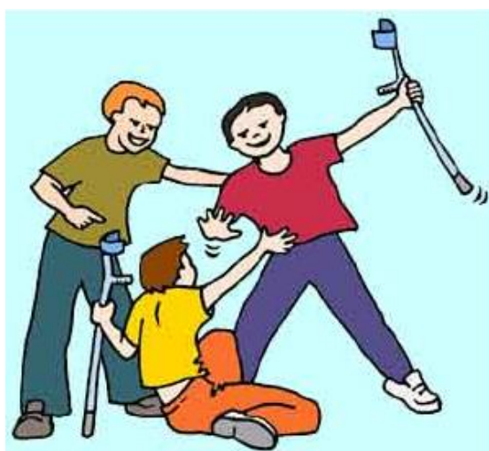
Εικόνα 1 - http://xenesglosses.eu/2013/02/bullying-2/

Διατυπώστε τις απόψεις σας μέσω του forum της ομάδας σας.