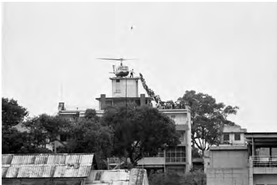
Η εμβληματική εικόνα εκκένωσης της Σαϊγκόν, στην ταράτσα κτιρίου κοντά στην πρεσβεία των ΗΠΑ

Το δίμηνο Μαρτίου-Απριλίου 1975, οι δυνάμεις των Βιετκόνγκ διέλυσαν τις νοτιοβιετναμικές δυνάμεις και κατέλαβαν τη Σαϊγκόν. Το μεσημέρι της 30ής Απριλίου, την ώρα που το τελευταίο ελικόπτερο απομακρυνόταν από την πρεσβεία των ΗΠΑ στη Σαϊγκόν, στον περίγυρο αυτής εισερχόταν το πρώτο άρμα των Βορειοβιετναμέζων.