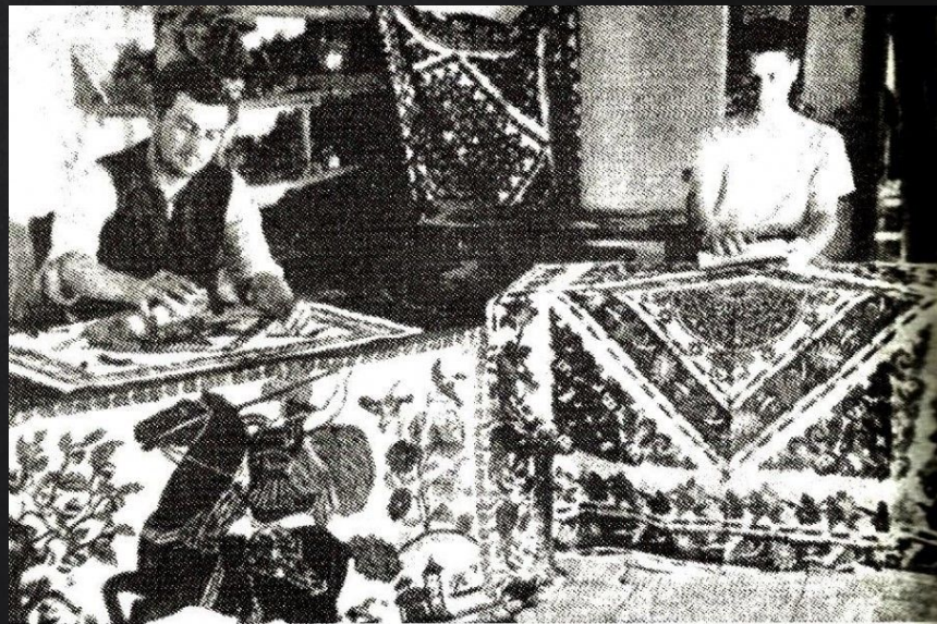
Εργαστήριο σταμπωτών Ν. Σαΐνη. Φωτογραφία από τα "Θεσσαλικά χρονικά"