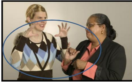
ΟΙ ΔΥΟ ΚΥΡΙΕΣ ΣΥΖΗΤΑΝΕ

ΟΤΑΝ ΕΝΑ ΠΑΙΔΙ ΓΕΝΝΙΕΤΑΙ ΜΕ ΚΑΠΟΙΑ ΠΡΟΒΛΗΜΑΤΑ ΑΚΟΗΣ ΣΥΝΗΘΩΣ ΤΟΥ ΒΑΖΟΥΝ ΕΝΑ ΑΚΟΥΣΤΙΚΟ ΠΟΥ ΤΟ ΒΟΗΘΑΕΙ ΝΑ ΑΚΟΥΕΙ ΕΣΤΩ ΚΑΙ ΠΟΛΥ ΧΑΜΗΛΑ ΚΑΠΟΙΟΥΣ ΗΧΟΥΣ ΚΑΙ ΝΑ ΜΑΘΕΙ ΕΤΣΙ ΝΑ ΜΙΛΑΕΙ