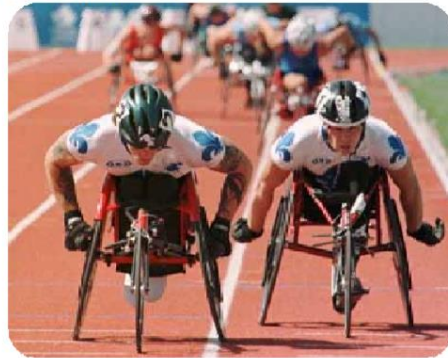
ΔΡΟΜΕΙΣ ΠΟΥ ΑΓΩΝΙΖΟΝΤΑΙ