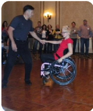
Η ΚΟΠΕΛΑ ΧΟΡΕΥΕΙ

ΤΑ ΑΤΟΜΑ ΠΟΥ ΒΡΙΣΚΟΝΤΑΙ ΣΕ ΑΝΑΠΗΡΙΚΟ ΚΑΡΟΤΣΑΚΙ ΜΠΟΡΕΙ ΝΑ ΜΗΝ ΜΠΟΡΟΥΝ ΝΑ ΠΕΡΠΑΤΗΣΟΥΝ ΑΛΛΑ ΕΧΟΥΝ ΜΕΓΑΛΗ ΔΥΝΑΜΗ ΨΥΧΗΣ ΚΑΙ ΔΕΝ ΤΟΥΣ ΣΤΑΜΑΤΑΕΙ ΑΠΟ ΤΟ ΝΑ ΧΟΡΕΥΟΥΝ Η ΝΑ ΑΣΧΟΛΟΥΝΤΑΙ ΜΕ ΤΟΝ ΑΘΛΗΤΙΣΜΟ.