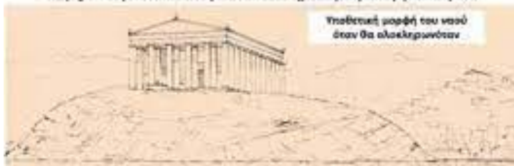
Υποθετική μορφή του ναού όταν θα ολοκληρωνόταν