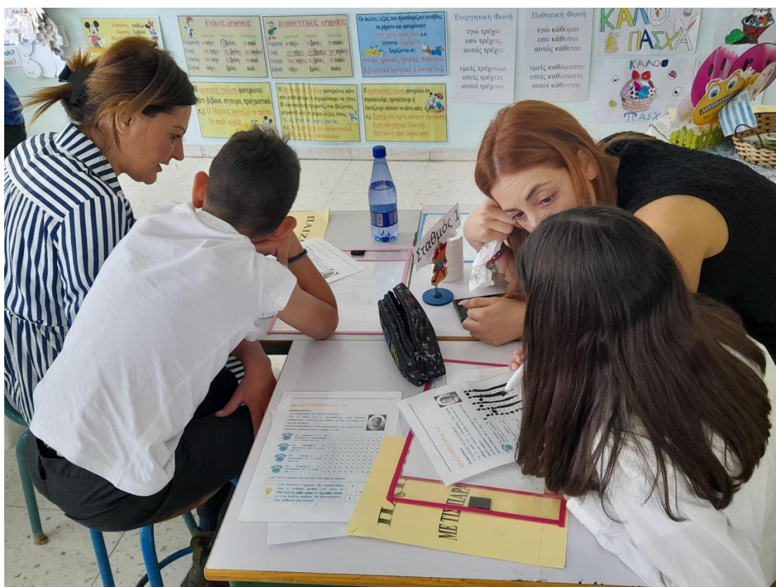
Συνεργασία γονέων και μαθητών για μια μέρα με ανοιχτό σχολείο στην κοινωνία