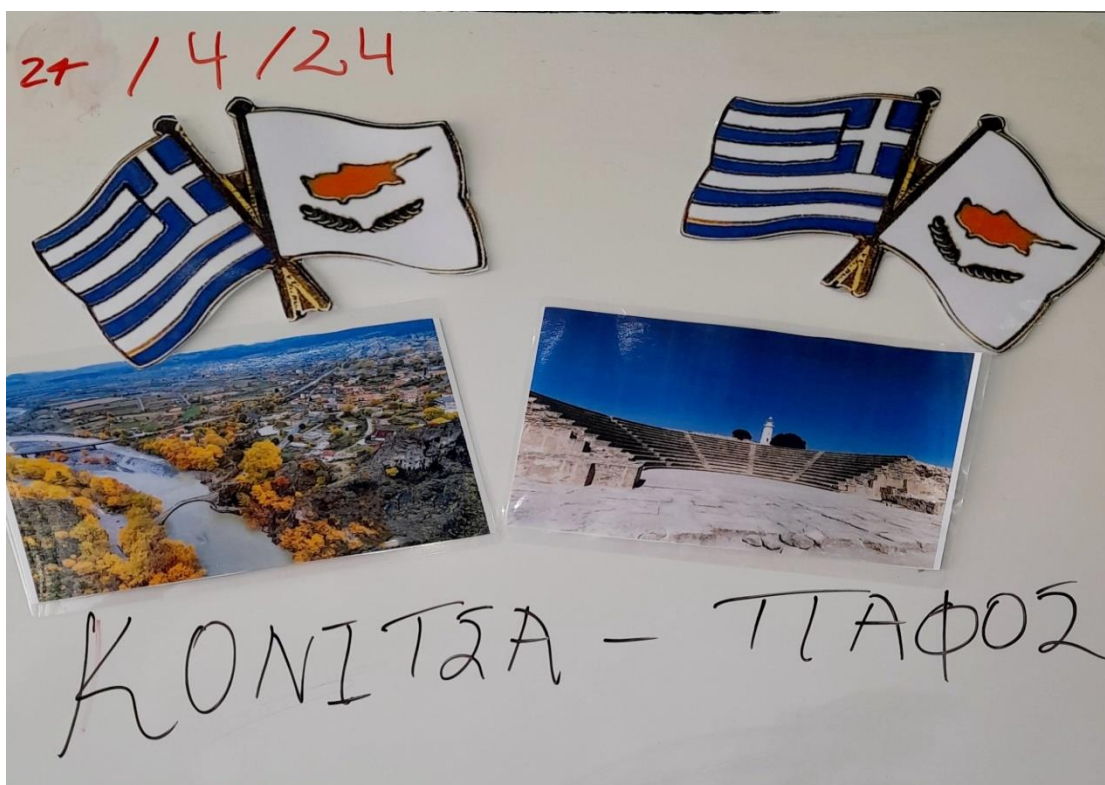
Αναμνηστική ανάρτηση από την επίσκεψη αντιπροσωπίας 1 ου Δ.Σ. Κόνιτσας στην Πάφο