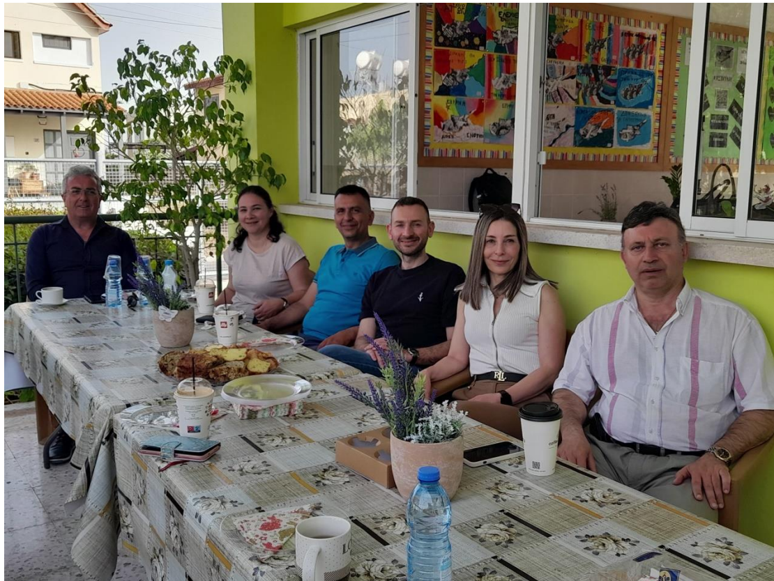
Συνάντηση με εκπαιδευτικούς από το 1 ο Δ.Σ. Κόνιτσας στο Δ.Σ. Έμπας Πάφου