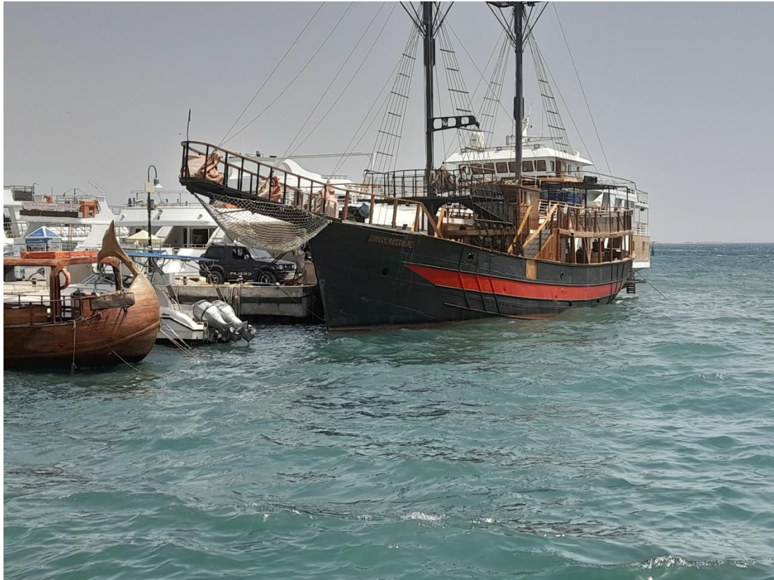
Ιστιοφόρο στο όμορφο λιμανάκι της Πάφου

Παραστατική ανάρτηση μαθητών για την εκδήλωση ιστορικής μνήμης στο σχολείο τους