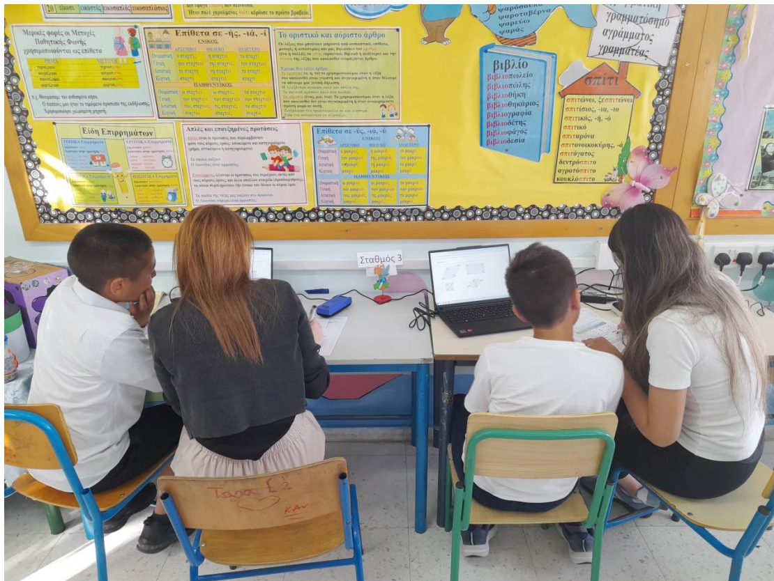
«Γονείς και μαθητές στο ίδιο θρανίο» στην Ε΄ τάξη του Δ.Σ. Έμπας Πάφου