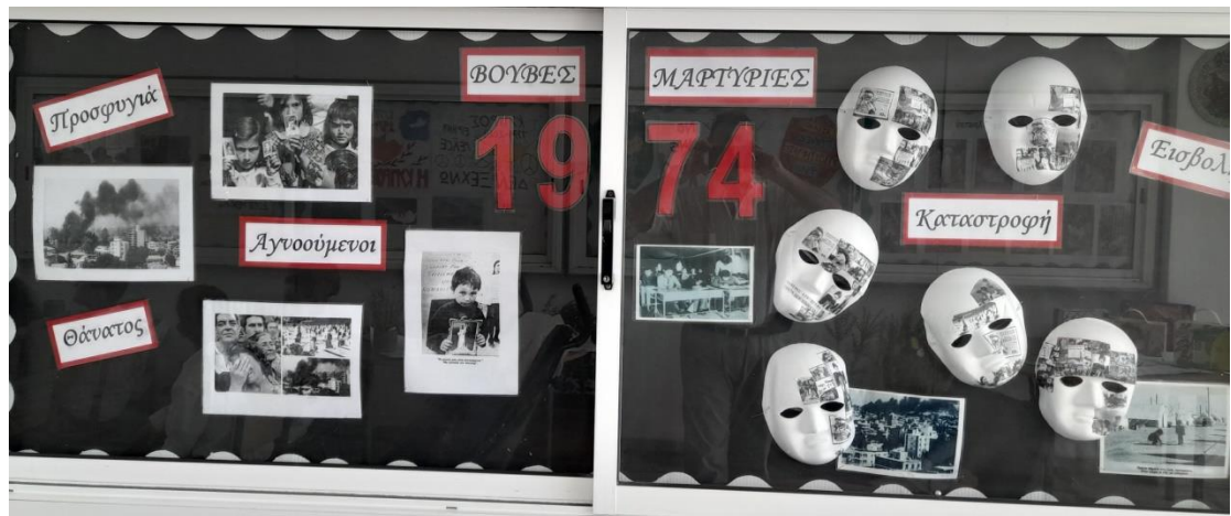
Χαρακτηριστική διαθεματική προσέγγιση για την ημέρα ιστορικής μνήμης και τιμής προς τους αγνοούμενους και πεσόντες κατά την τουρκική εισβολή στην Κύπρο του 1974