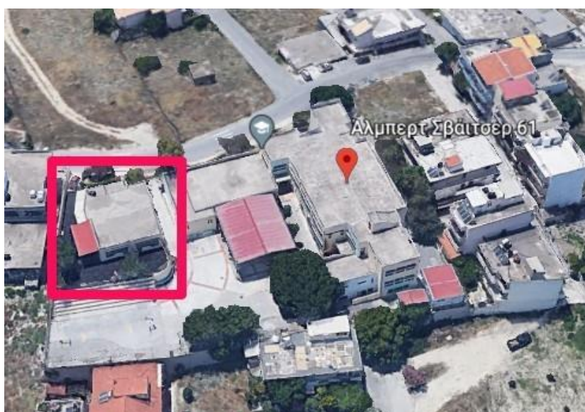
Εικ. 1. Κάτοψη σχολείου από GOOGLE EARTH

Διευκρινίζεται, ότι σε περίπτωση κρίσης οι μαθητές/μαθήτριες παραδίδονται μόνο στους γονείς/κηδεμόνες τους ή στα πρόσωπα που οι γονείς/κηδεμόνες έχουν ορίσει γραπτώς για την παραλαβή των μαθητών/τριών από τη σχολική μονάδα.