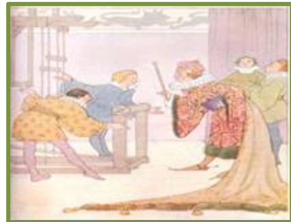
Τα ρούχα του βασιλιά