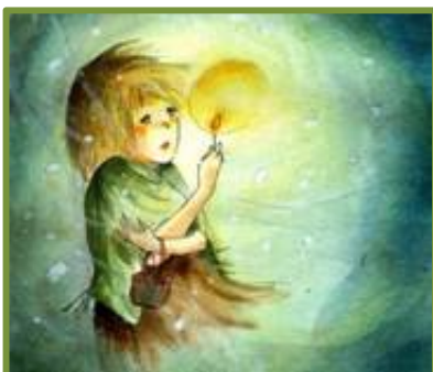
Το κοριτσάκι με τα σπέρτα