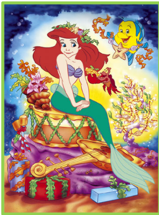
Η μικρή γοργόνα