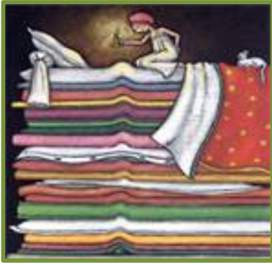
Η πριγκίπισσα και το ρεβίθι