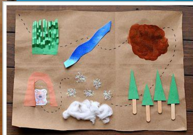
We're Going on a Bear Hunt MAP & BINOCULARS