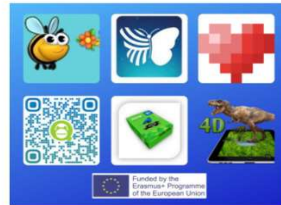
New web tools and internet

Funded by the Erasmus+ Programme of the European Union