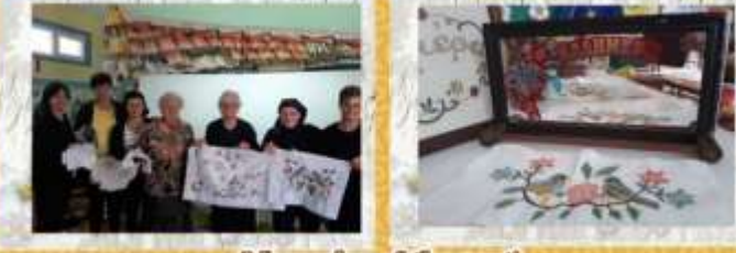
Moments of the past!