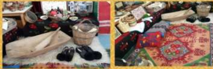
Creation of museum in our school