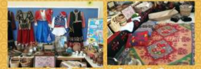
Creation of museum in our school