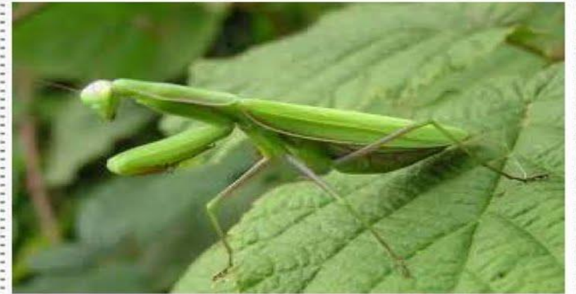
Αλογάκι της Παναγίας