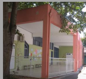
3 ο Νηπιαγωγείο Βέροιας