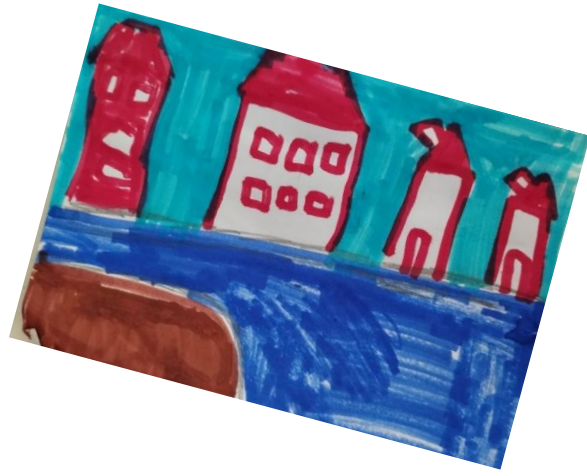
Στη Κρήτη υπάρχει το ανάκτορο της Κνωσού και ο Λαβύρινθος.