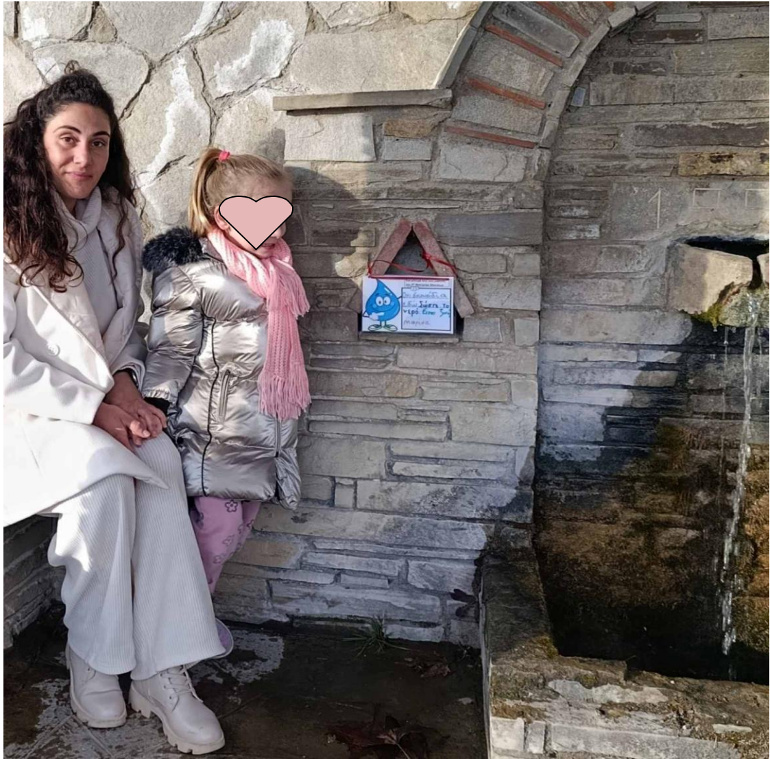
Μαρίνα : σε βρύση στην Κορομηλιά Καστοριάς