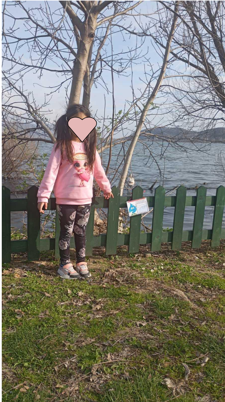
Έλλη :στην παραλίμνιο λεωφόρο των Κύκνων στην πόλη της Καστοριάς