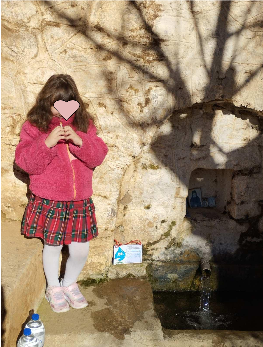
Σοφία : σε πηγή αγιάσματος στη Λεύκη Καστοριάς