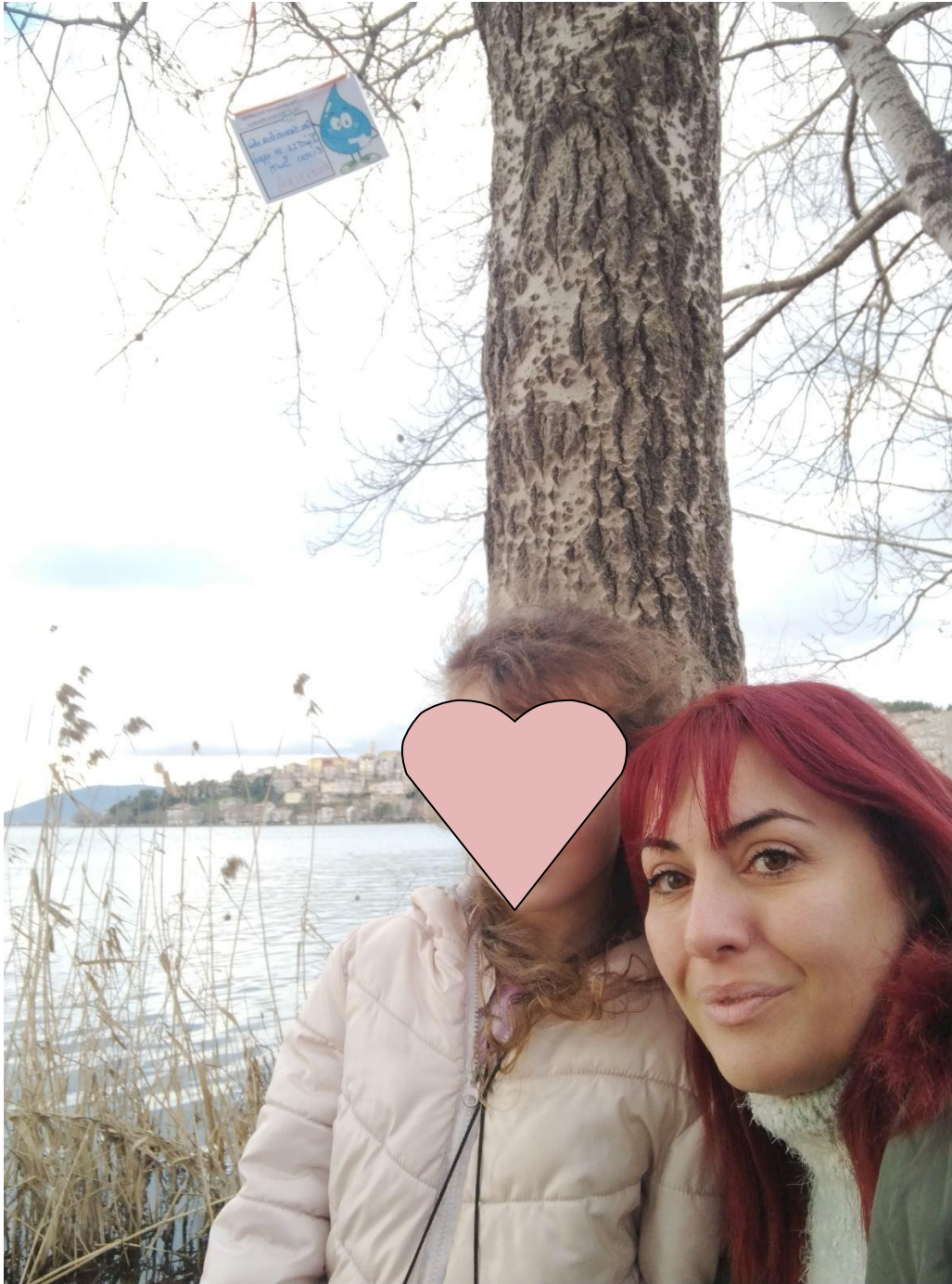
Βασιλική :στην παραλίμιο λεωφόρο των Κύκνων στην πόλη της Καστοριάς