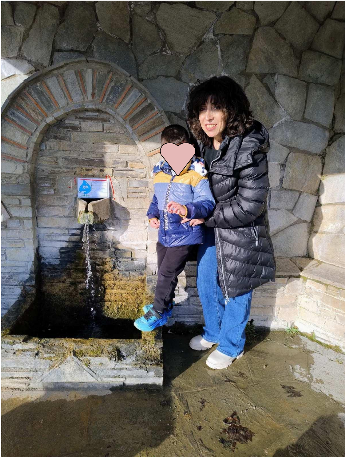
Στυλιανός: σε βρύση στην Κορομηλιά Καστοριάς