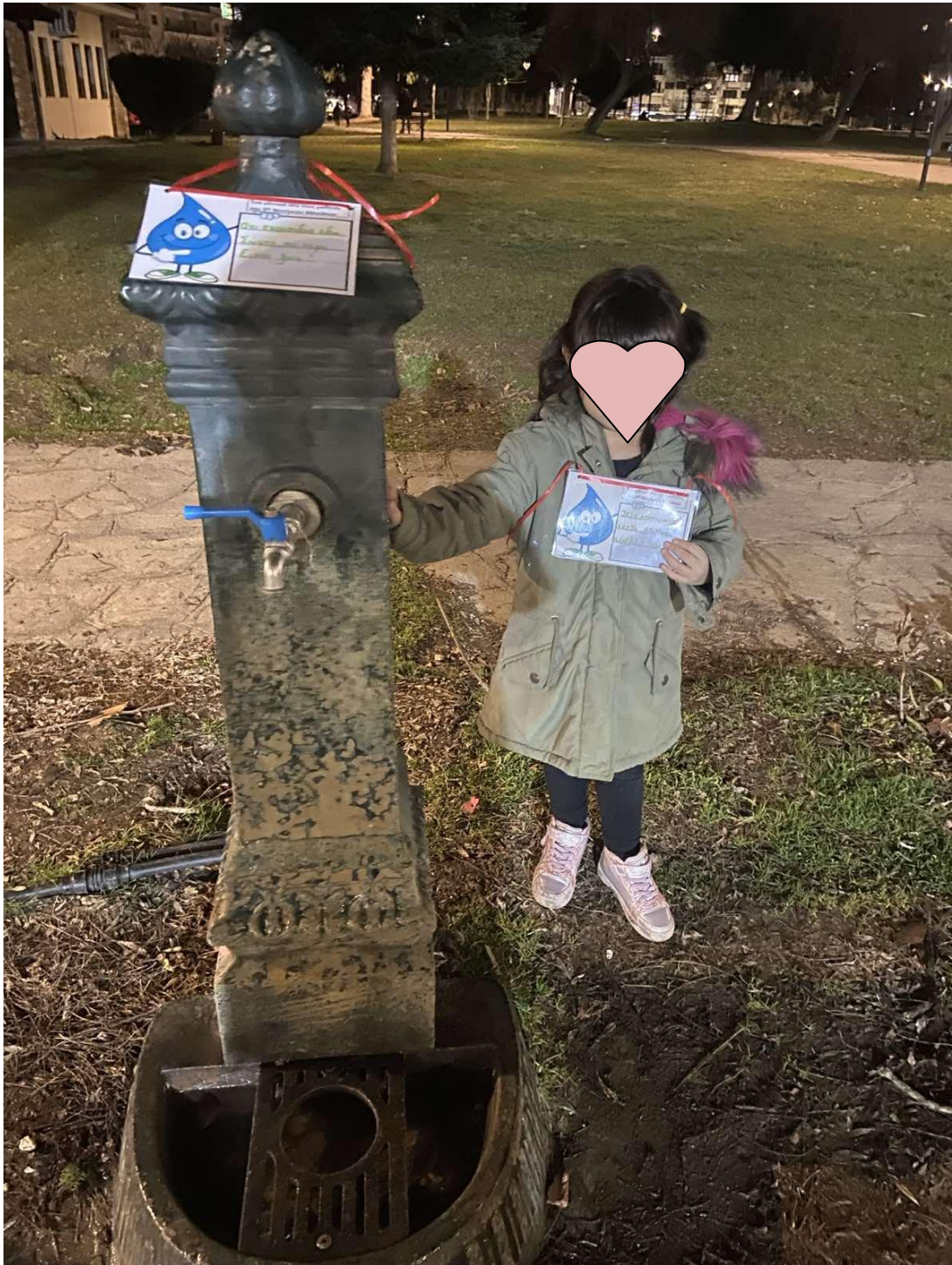
Σαλώμη : στο πάρκο Ολυμπιακής Φλόγας στην πόλη της Καστοριάς