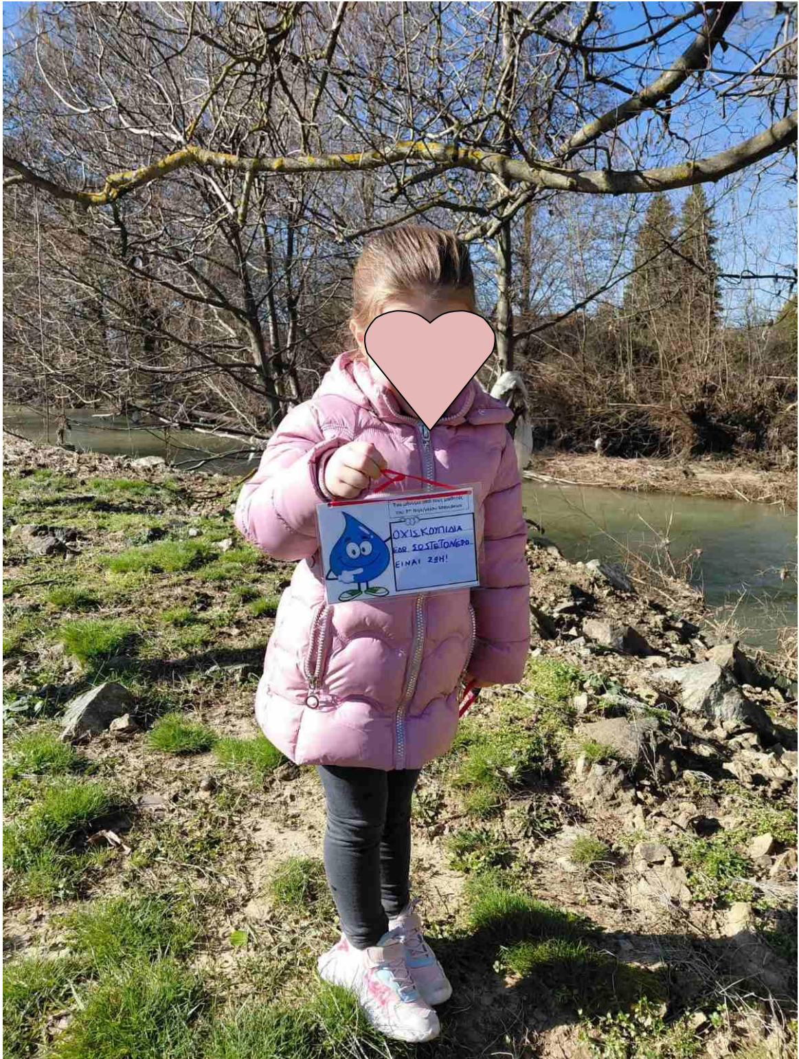
Δέσποινα : στην όχθη του Αλιάκμονα στους Μανιάκους (απέναντι από το ξενοδοχείο)