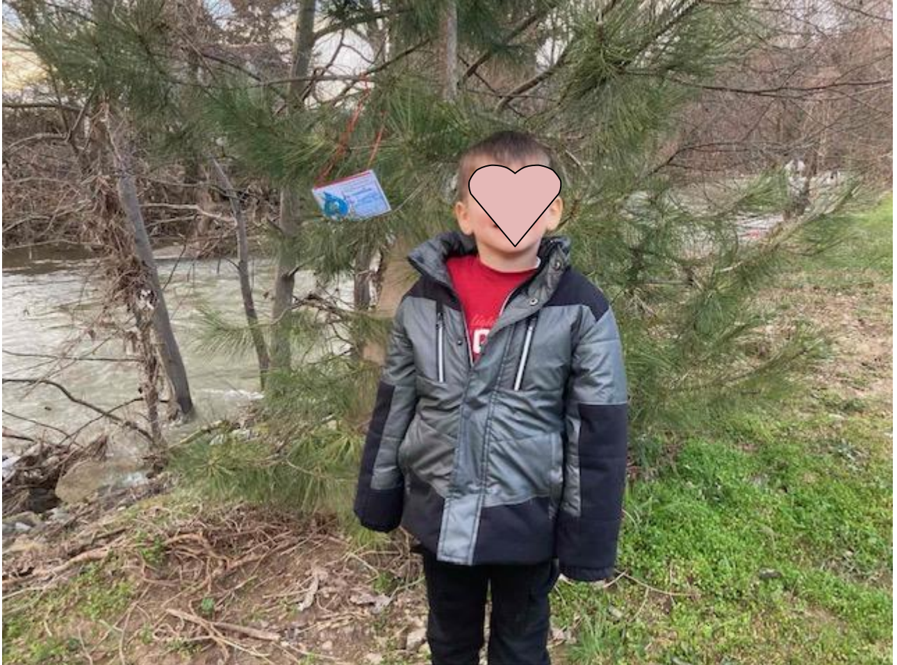
Κωνσταντίνος : στην όχθη του Αλιάκμονα κάτω από τη γέφυρα στους Μανιάκους