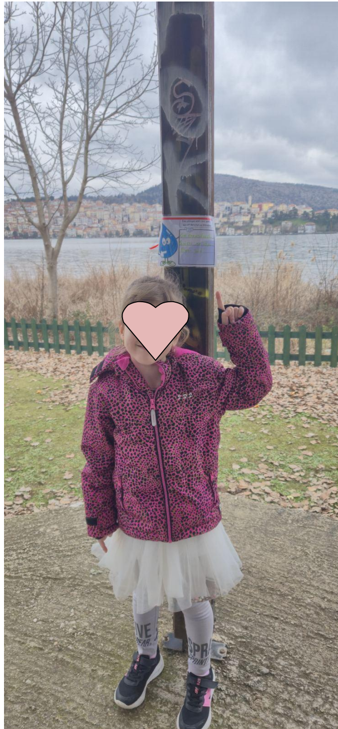
Δήμητρα : στην παραλίμνιο λεωφόρο των Κύκνων στην πόλη της Καστοριάς