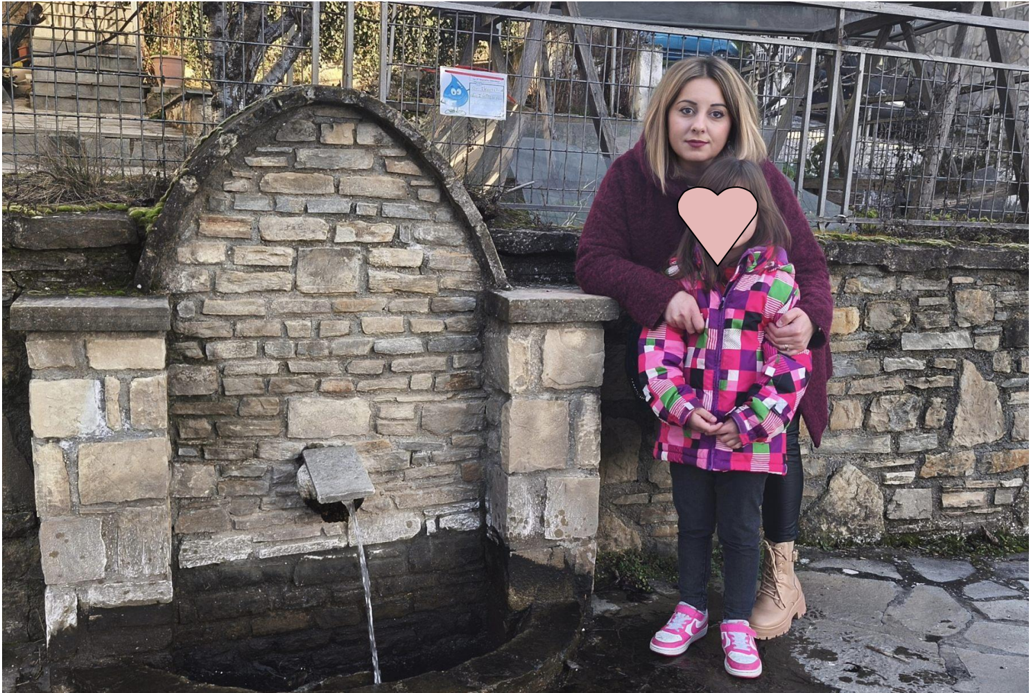
Αθηνά -Ηλιάνα : Στην παλιά βρύση του Τσάπα στους Μανιάκους !