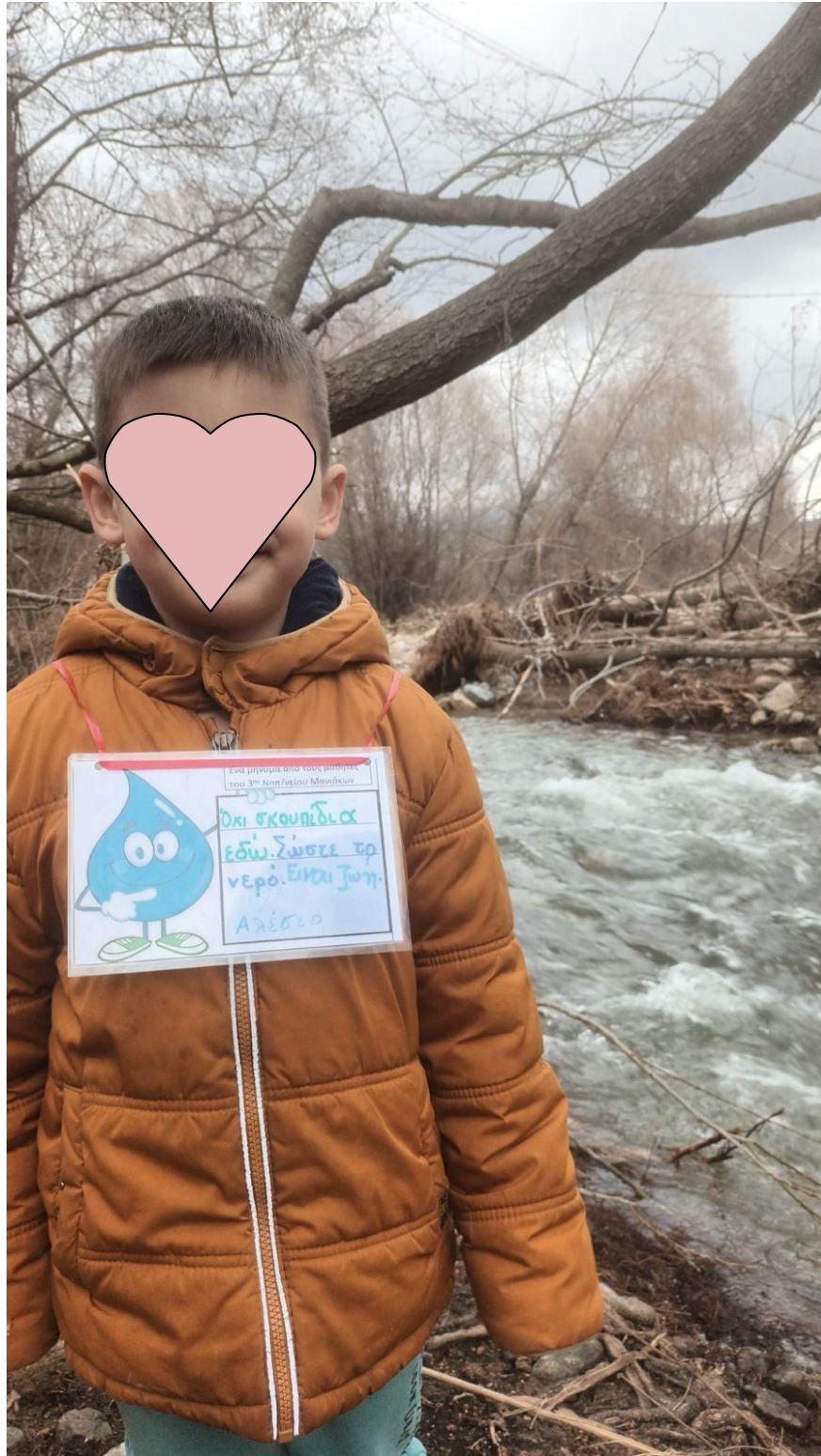
Αλέσιο: στην όχθη του Λαδοπόταμου Κορομηλιάς που χύνεται στον Αλιάκμονα