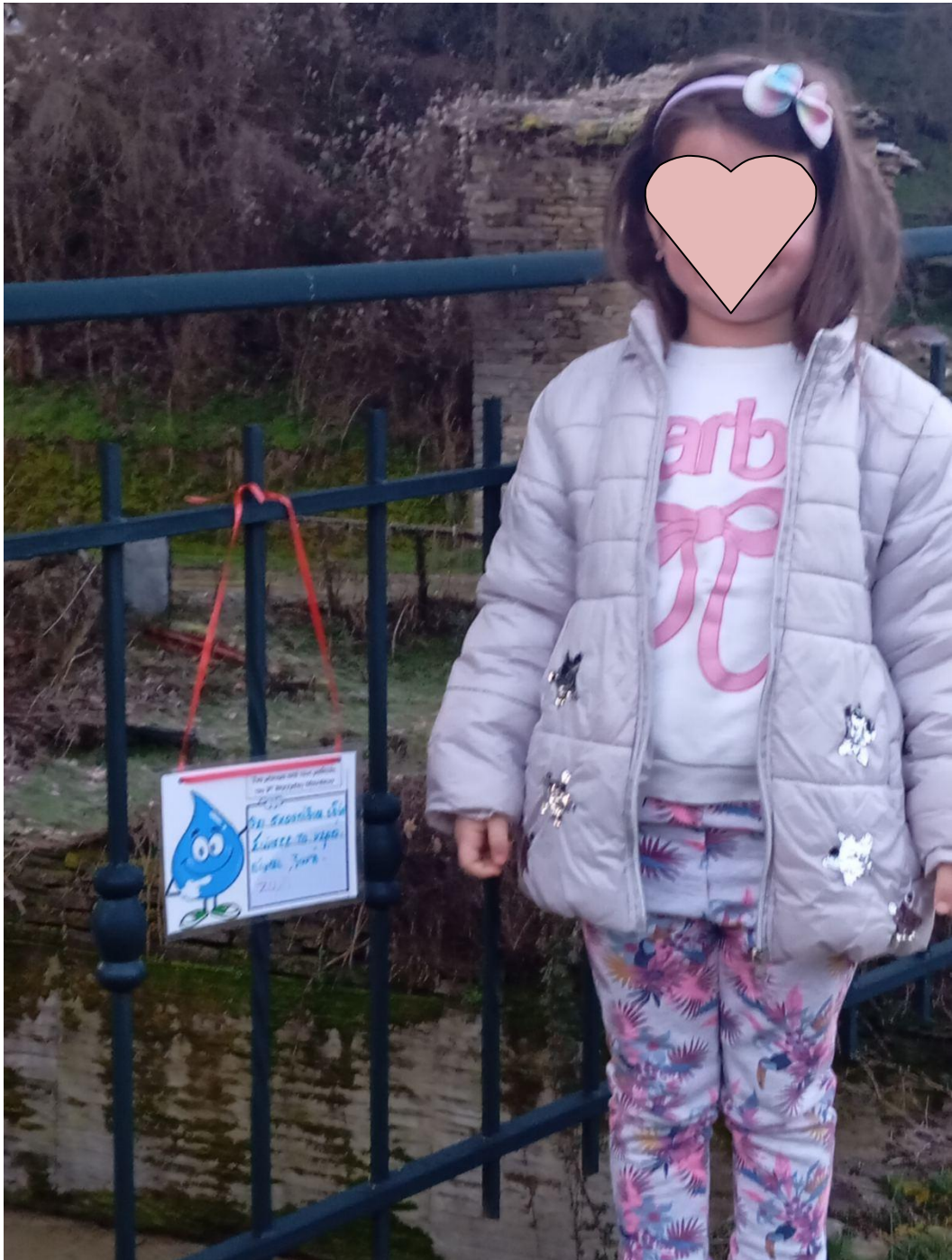
Ζωή: στο γεφύρι Επταχωρίου Καστοριάς από όπου περνά παραπόταμος του Σαραντάπορου .