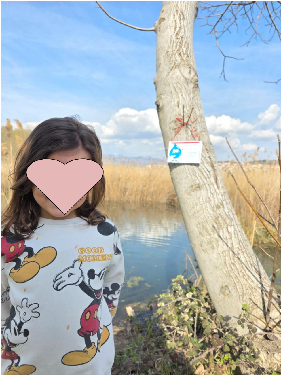
Αριάδνη : στην όχθη της λίμνης της Καστοριάς στην λεωφόρο των Κύκνων