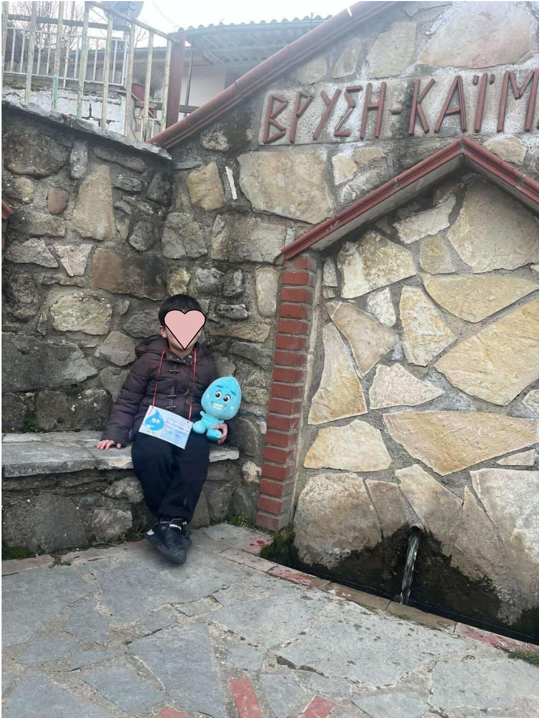
Ραφαήλ : στη βρύση Καϊμακάμη στη Διποταμία Καστοριάς