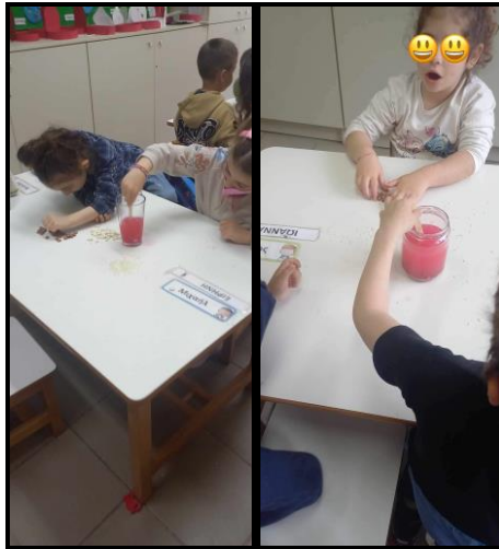
Εικόνα 6:Πείραμα με τα συστατικά του νερού