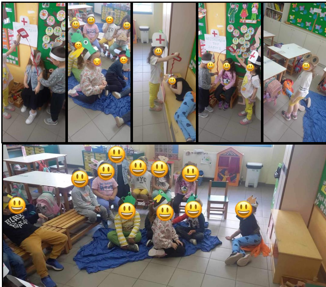
Εικόνα 3: Δραματοποίηση παραμυθιού

2. Δραματοποιήσαμε την ιστορία της Μαριλούς. Φτιάξαμε μάσκες και "ζωντανέψαμε" τους ήρωες της ιστορίας.