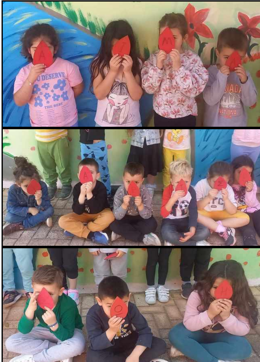
Εικόνες 10, 11, 12, 13: ΔΩΣΕ ΑΙΜΑ, ΧΑΡΙΣΕ ΖΩΗ

Ευχαριστούμε το Εθνικό Κέντρο Αιμοδοσίας για την δωρεάν χορήγηση του βιβλίου του Κώστα Μάγου "Τι ζητούσε η αλεπού στη ρεματιά".