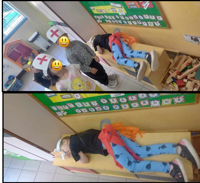
Εικόνα 4: Δραματοποίηση παραμυθιού