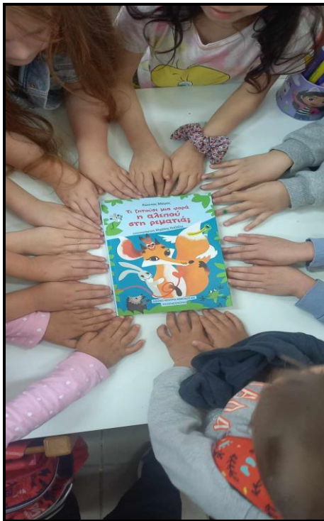
Εικόνα 1: Παραμύθι: «Τι ζητούσε η αλεπού στη ρεματιά;»

Στο πλαίσιο των εργαστηρίων δεξιοτήτων του 2ου θεματικού κύκλου: Ενδιαφέρομαι και ενεργώ-Κοινωνική Συναίσθηση και Ευθύνη , διαβάσαμε το παραμύθι του Εθνικού Κέντρου Αιμοδοσίας " Τι ζητούσε μια φορά η αλεπού στη ρεματιά; ", που έγραψε ο Κώστας Μάγος.