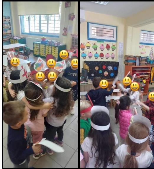
Εικόνες 7, 8: Δραματοποίηση λειτουργίας συστατικών αίματος

10. "Σπάσαμε" και έναν κώδικα για να βρούμε την μυστική φράση: