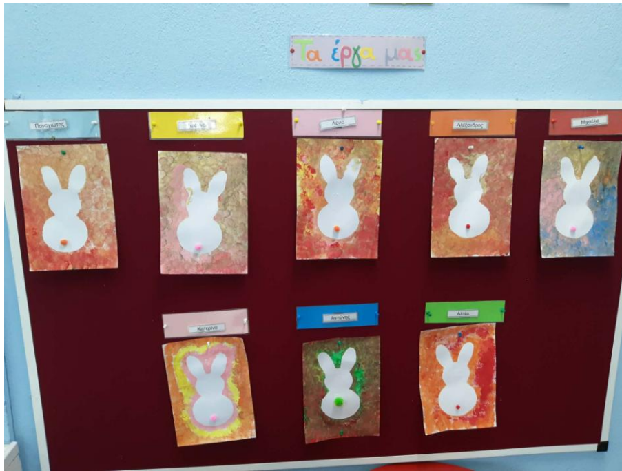
Τα αυγά μας