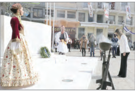
Λιτός ο εορτασμός της 25ης Μαρτίου στη Μεσσηνία