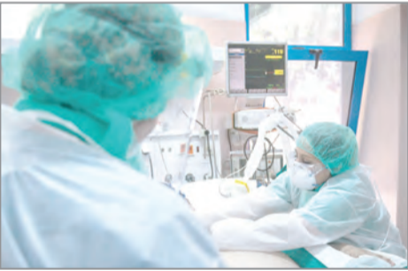
18 νέα κρούσματα το τελευταίο 48ωρο