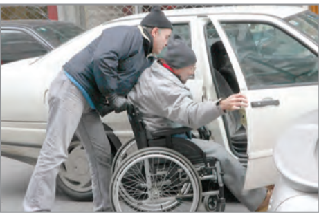
Προσωπικούς βοηθούς από το κράτος θα έχουν τα άτομα με αναπηρία