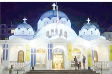
Οι Β' Χαιρετισμοί σε ζωντανή μετάδοση από την Πύλο