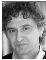
Γράφει ο Θανάσης Λαγός

Επιχειρώντας να απαντήσουμε με έναν σαφή ορισμό, θα εντάξουμε στις υγιείς επιχειρηματικές δυνάμεις τα φυσικά και τα νομικά πρόσωπα που δραστηριοποιούνται οικονομικά με στόχο να έχουν έσοδα κυρίως από την πώληση των προ-