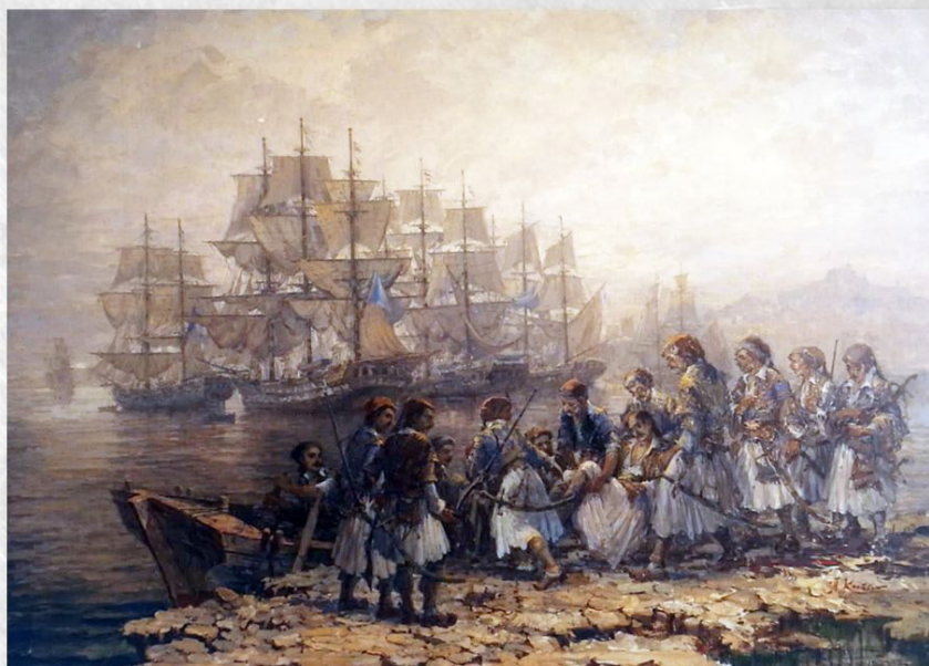
«Ο θανάσιμος τραυματισμός του Γ. Καραϊσκάκη στο Φάληρο» ΑΝΤΩΝΗΣ ΚΑΝΑΣ