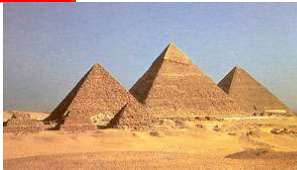
Οι πυραμίδες της Γκίζας όπως σώζονται σήμερα. Η τρίτη στο βάθος είναι του Χέοπα και η μεγαλύτερη.

Όταν τελείωσε το κύριο μέρος της πυραμίδας έμοιαζε με σκάλα. Στη συνέχεια αυτά τα σκαλοπάτια τα κάλυψαν με κύβους από άσπρο ασβεστόλιθο, που κόπηκαν έτσι που να σχηματίζουν μια γυαλιστερή επιφάνεια. Ταίριαξαν τόσο καλά που δε χωρούσε ανάμεσά τους να μπει μια λάμα μαχαριού. Το τελικό ύψος της οικοδομής έφτασε τα 147 μέτρα. Κάθε πλευρά της βάσης της Μεγάλης Πυραμίδας έχει 230 μέτρα! Καλύπτει μια έκταση πιο μεγάλη από 9 γήπεδα ποδοσφαίρου.