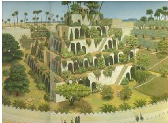
Οι Κρεμαστοί Κήποι, όπως τους φανταζόμαστε από τις περιγραφές αρχαίων Ελλήνων και Ρωμαίων συγγραφέων

Οι Κρεμαστοί Κήποι κατασκευάστηκαν μάλλον κοντά στον ποταμό Ευφράτη. Αποτελούνταν από διαδοχικές αναβαθμίδες, όπου η ψηλότερη πρέπει να είχε 40 μέτρα ύψος. Εκεί φύτευαν κάθε είδος δέντρου και φυτού, που μεταφέρθηκαν με βοϊδάμαξες από κάθε περιοχή της αυτοκρατορίας. Ανάμεσά τους υπήρχαν συκιές, αμυγδαλιές, καστανιές, ροδιές, τριανταφυλλιές, νούφαρα, και αρωματικοί θάμνοι. Υπήρχε ένα πολύ καλό υδρευτικό σύστημα που τροφοδοτούσε συνεχώς τα φυτά με νερό από τον Ευφράτη. Το νερό του συστήματος το αντλούσαν με δοχεία που τα ανέβαζαν με τα χέρια τους ή με μάγγανο οι δούλοι! Στη συνέχεια το νερό κατέβαινε στις πιο χαμηλές αναβαθμίδες από αυλάκια και τεχνικούς καταρράκτες, διατηρώντας το έδαφος πάντα υγρό.