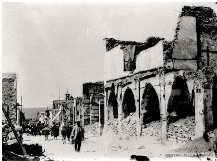
Η οδός 25ης Αυγούστου μετά τα βίαια επεισόδια

χριστιανό υπάλληλο, Στυλιανό Αλεξίου, ένας εκ των διαμαρτυρούμενων Τουρκοικρητών χτύπησε με ρόπαλο έναν Άγγλο, του οποίου το όπλο εκπυρσοκρότησε σκοτώνοντας έναν Τούρκο. Από τη συμπλοκή που ακολούθησε μεταξύ Άγγλων και Τουρκοικρητικών σκοτώθηκαν 18 Άγγλοι. 3