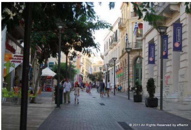
Η σημερινή εικόνα της οδού 25ης Αυγούστου

Μετά την Ένωση της Κρήτης με την Ελλάδα, τα κτήρια ξαναχτίστηκαν ακόμη λαμπρότερα υιοθετώντας το νεοκλασικό αρχιτεκτονικό ρυθμό που