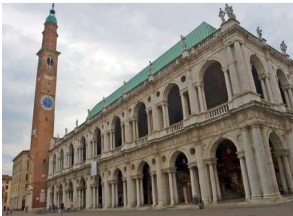
Η βασιλική της Vicenza

λειτούργουσε και ως χώρος συναντήσεως και ψυχαγωγίας τους, όπου έπαιζαν και τυχερά παιχνίδια. Από τους εξώστες της ανακοίνωναν οι κήρυκες τα διατάγματα της πολιτείας και ο δούκας εκφωνούσε λόγους προς το λαό ή παρακολουθούσε τις δημόσιες γιορτές και λιτανείες.