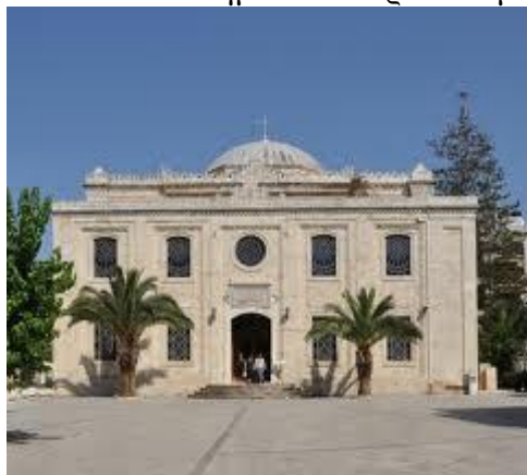
Ο ναός του Αγίου Τίτου σήμερα

Ένα από τα σημαντικότερα κτίσματα της οδού 25 ης Αυγούστου είναι και ο