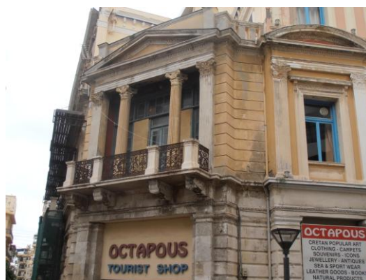
Η απότμηση της γωνίας στο Μέγαρο Λιοπυράκη

στιβαρό δίνοντας την εντύπωση ενός βάρους πάνω στο οποίο στηρίζεται το υπόλοιπο κτήριο. Ο πρώτος όροφος είναι ο πιο διακοσμημένος. Ενώ ο δεύτερος διαμορφώθηκε ως «απτικός», έχει δηλαδή χαμηλότερο ύψος και πιο λιτή διακόσμηση από τον πρώτο. Από τον αρχιτέκτονα τηρήθηκαν αυστηροί άξονες συμμετρίας όσον αφορά την τοποθέτηση των ανοιγμάτων και των εξωστών στις δυο κύριες όψεις αλλά και στην απότμηση της γωνίας. Σήμερα το κτήριο στο ισόγειό του στεγάζει εμπορικά καταστήματα.