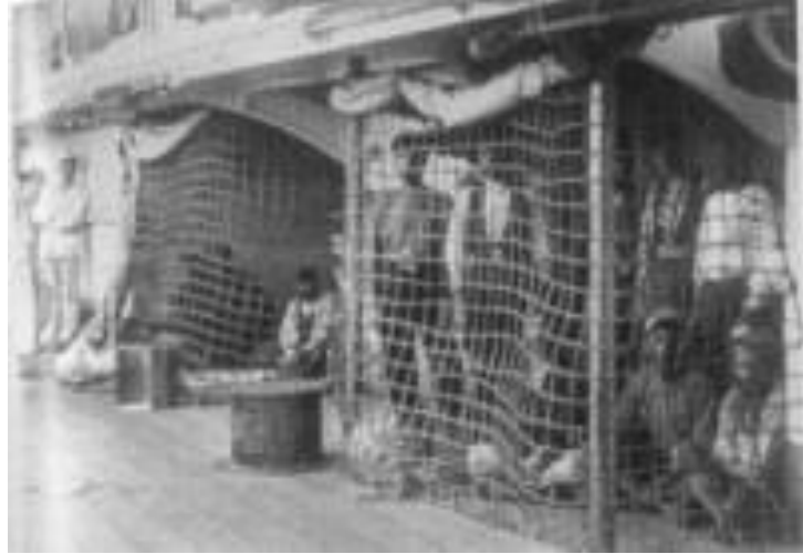
Σπάνια φωτογραφία που τράβηξε Άγγλος αξιωματικός και απεικονίζει τους καταδικασθέντες βασιβουζούκους να κρατούνται προσωρινά πάνω στο αγγλικό πολεμικό «Αφροδίτη».

Μετά τα δραματικά αυτά γεγονότα, οι Μεγάλες Δυνάμεις αποφασίζουν να δεχτούν το επίμονο αίτημα των Κρητικών, δηλαδή να φύγει από το νησί ο τουρκικός στρατός. Πράγματι στις 2 του Νοέμβρη του 1898 αποσύρεται και ο τελευταίος τούρκος στρατιώτης, ανοίγοντας έτσι το δρόμο προς την ελευθερία της Κρήτης.