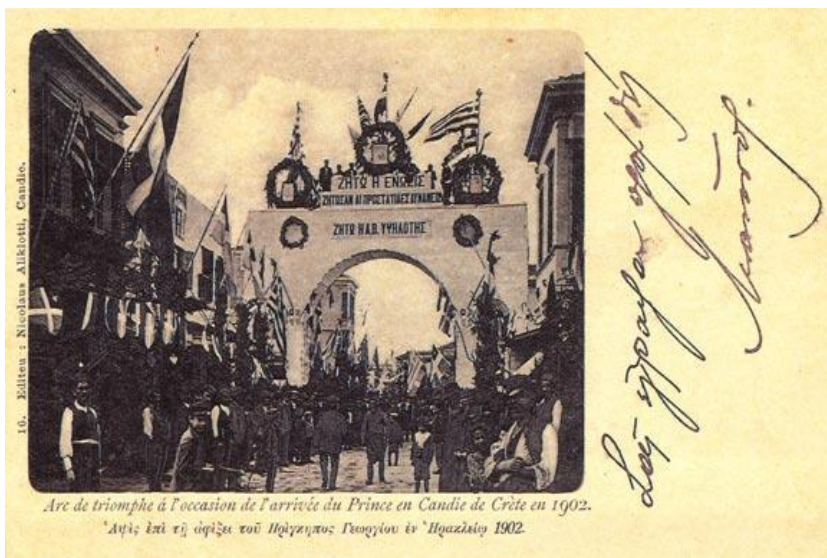
Αrc de triomphe à l'occasion de l'arrivée du Prince en Candie de Crète en 1902. Αψίδα επί τη άφιξη του Πρίγκιπας Γεωργίου εν Ήρακλείω 1902.

Ως πρώτος Αρμοστής της αυτόνομης Κρητικής Πολιτείας διορίζεται