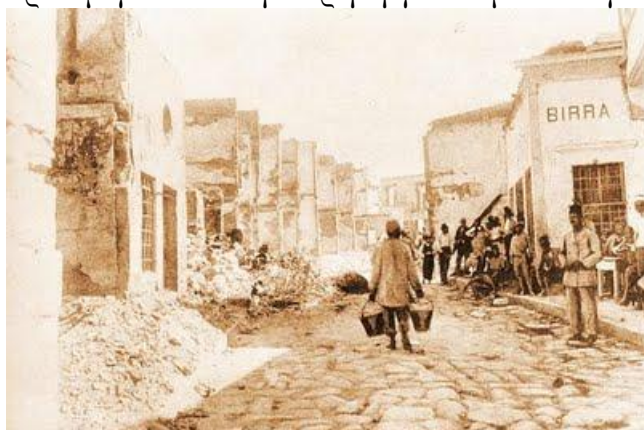
Η οδός 25ης Αυγούστου με εμφανή τα σημάδια των καταστροφών

Σχετικά με τον αριθμό των θυμάτων των επεισοδίων επικρατεί σύγχυση στις πηγές. Ο πιο μικρός αριθμός δίδεται από την τουρκική πλευρά που κάνει λόγο για «εκατό το πολύ» νεκρούς, ενώ κάποιες ελληνικές πηγές αναφέρουν 800 νεκρούς. Είναι λογικό και οι δύο πλευρές να υπερβάλλουν, η καθεμιά για τις δικές της σκοπιμότητες, όμως πρόσφατες μελέτες 7 που ασχολήθηκαν με το θέμα υπολογίζουν τον αριθμό των θυμάτων μεταξύ του χριστιανικού πληθυσμού σε 300 περίπου. Θα πρέπει να σημειωθεί ότι στο Ηράκλειο του 1898 κατοικούσαν 1270 περίπου χριστιανοί. Από τους διασωθέντες χριστιανούς κάποιοι κατέφυγαν στο λιμάνι του Πειραιά, άλλοι πήγαν πρόσφυγες στη Σύρο, ενώ κάποιοι βρήκαν καταφύγιο σε χωριά του Ηρακλείου. Η εφημερίδα Σκριπ 8 περιγράφει μάλιστα συγκινητικές σκηνές που εκτυλίχθηκαν στο λιμάνι του Πειραιά, όπου Κρητικοί εγκατεστημένοι στην Αθήνα περίμεναν με μεγάλη αγωνία την άφιξη των τραυματιών και των προσφύγων από την Κρήτη για να μάθουν για την τύχη των συγγενών τους.