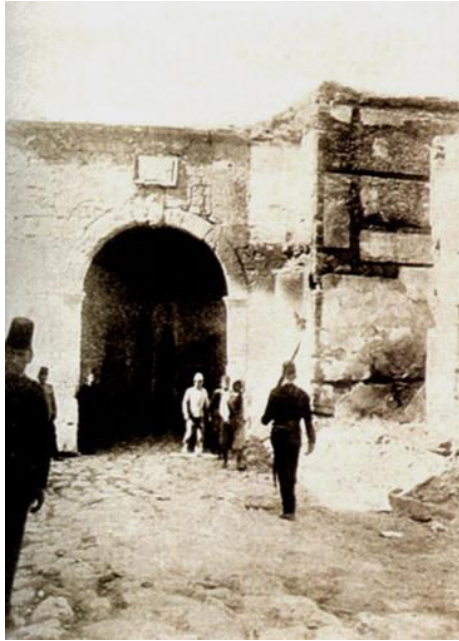
Η Πύλη του Μόλου, όπως ήταν λίγο πριν από τη σφαγή του 1898

Η οδός 25 ης Αυγούστου ενώνει το κέντρο της πόλης του Ηρακλείου με το λιμάνι. Είναι ο πεζόδρομος που ξεκινά από την πλατεία των Λιονταριών και κατηφορίζει προς τη θάλασσα. Ο δρόμος αυτός ήταν ανέκαθεν εμπορικός και έπαιξε σημαντικό ρόλο τόσο την περίοδο της Ενετοκρατίας όσο και στην Τουρκοκρατία. Οι Βενετοί τον ονόμαζαν Ruga Maistra (= κύριος δρόμος). Εκεί γινόταν la processione del Corpus Domini, μια λιτανεία των καθολικών