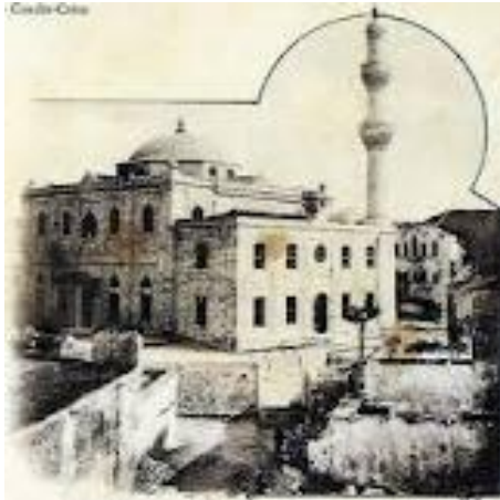
Ο ναός του Αγίου Τίτου ως Βεζίρ τζαμί επί Τουρκοκρατίας

καθιερώθηκε και πάλι, μετά από 256 χρόνια, στον Απόστολο Κρήτης Τίτο και στο ορθόδοξο δόγμα.