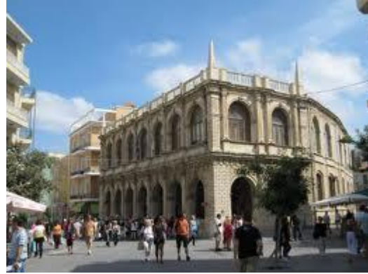
Η Λότζια του Ηρακλείου

Οικοδομήθηκε μεταξύ των ετών 1625 – 1628 από τον Γενικό Προβλεπτή της Βενετίας Φραγκίσκο Μοροζίνι, τον ίδιο που κατασκεύασε και την ομώνυμη κρήνη και πολλά άλλα έργα στον Χάνδακα. Πρόκειται για την τέταρτη και τελευταία Λότζια που χτίστηκε στην περίοδο της Ενετοκρατίας. Τα πολιτικά και κοινωνικά ήθη των Ενετών επέβαλλαν την ανέγερση ενός δημόσιου κτιρίου, όπου συνεδρίαζαν οι ευγενείς, οι άρχοντες και οι φεουδάρχες για να πάρουν αποφάσεις σε ζητήματα που αφορούσαν την οικονομική και εμπορική ζωή του τόπου. Παράλληλα