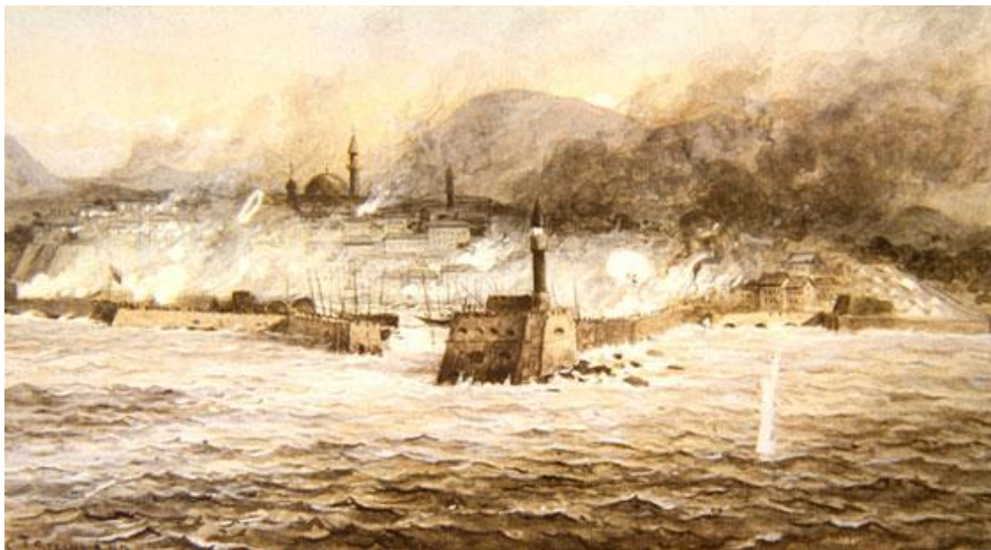
Το Ηράκλειο κατά τα δραματικά γεγονότα του 1898 (Αθήνα, Μουσείο Αθηνών)