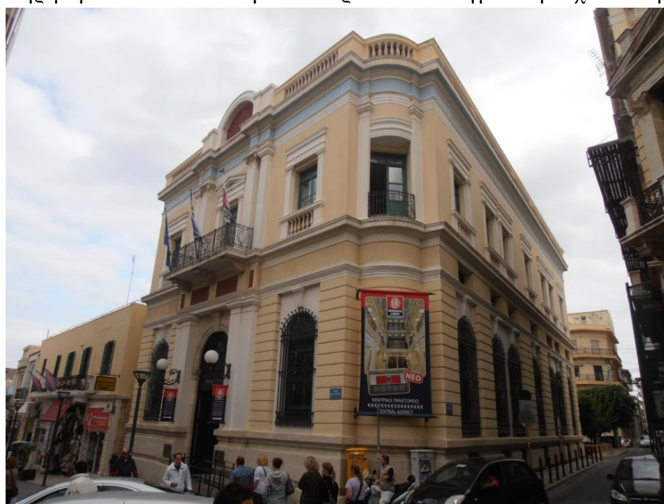
Η εξωτερική όψη του κτηρίου των Μινωικών Γραμμών

Το κτήριο στο οποίο στεγάζονται τα κεντρικά γραφεία των Μινωικών γραμμών βρίσκεται στη συμβολή των οδών 25 ης Αυγούστου 17 και Επιμενίδου. Η συντήρηση και αναπαλαιώσή του θεωρείται υποδειγματική. Σχεδιάστηκε το