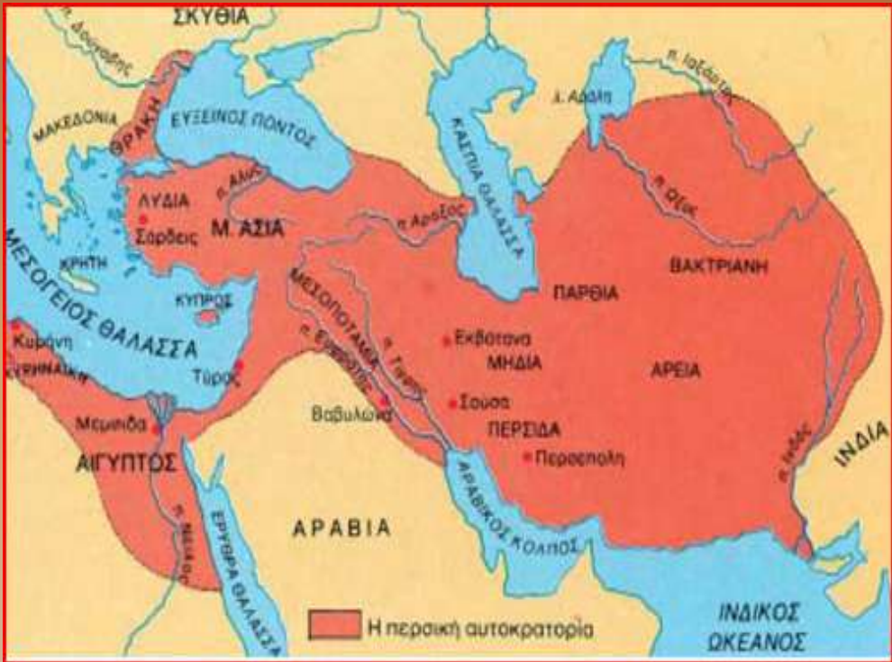
Η περσική αυτοκρατορία και ο ελληνικός κόσμος περί το 480 π.Χ