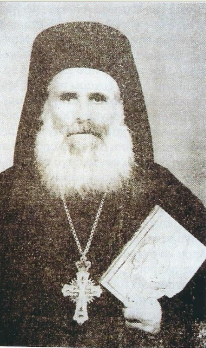
Ο Πανοσ. Αρχιμανδρίτης Διονύσιος Αμαραντίδης.