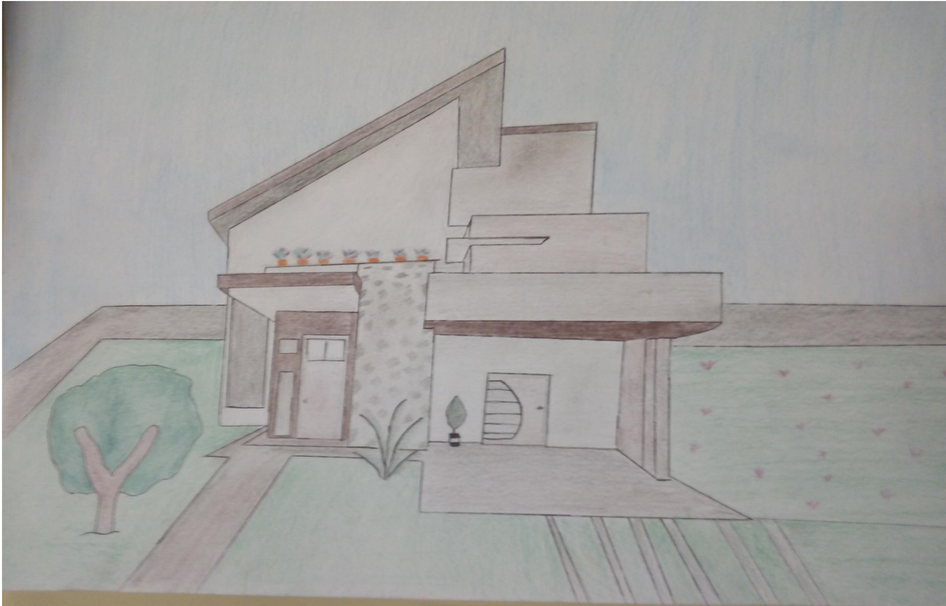
Εικόνα ζωγραφισμένη από την Μαρία Γαύρου