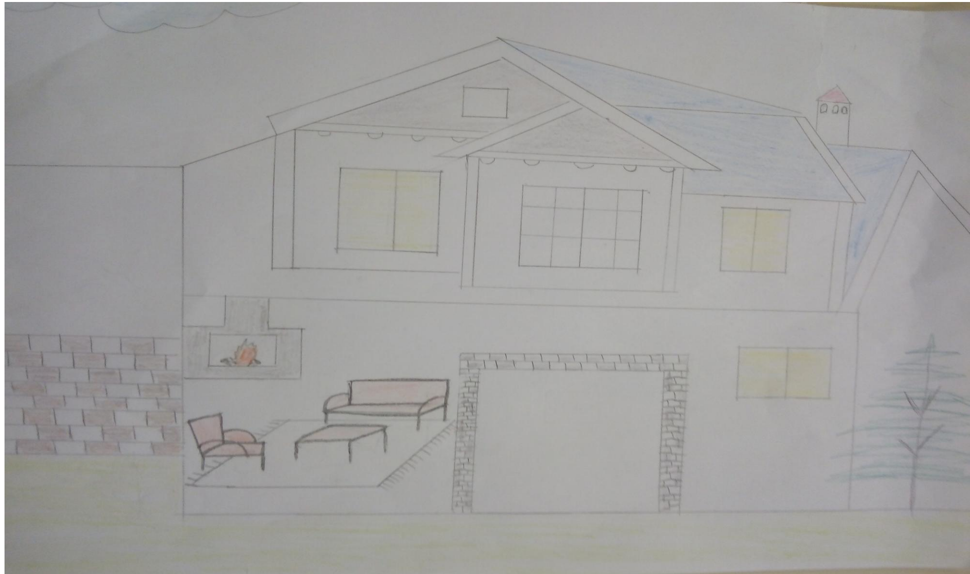
Εικόνα ζωγραφισμένη από τον Δημήτρη Καρατζέτσο