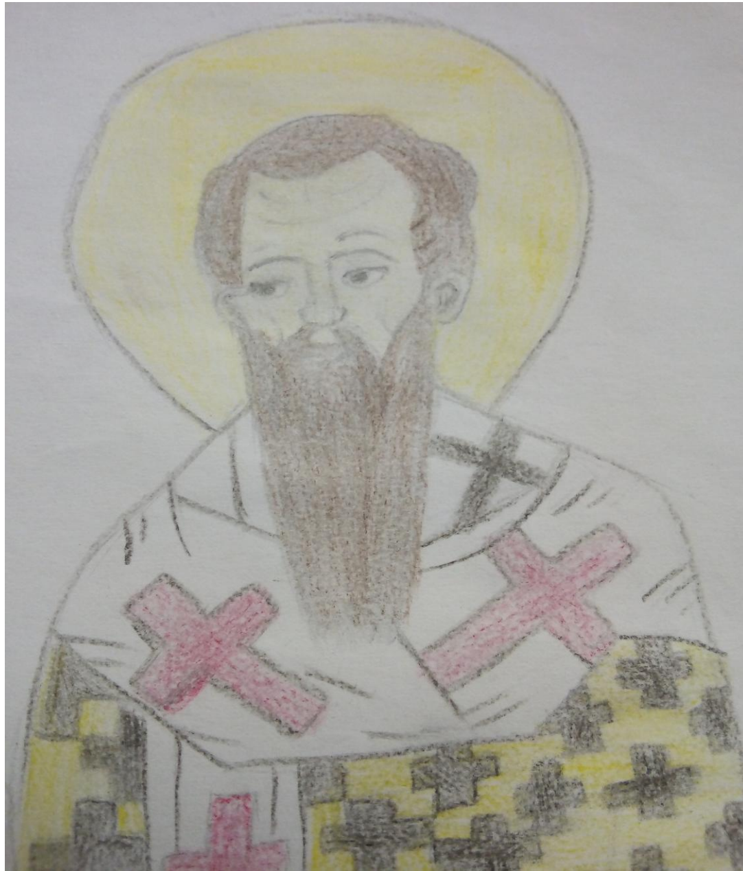
Μέγας Βασίλειος- εικόνα ζωγραφισμένη από την Ελένη Καρυπίδου