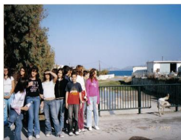
Ο χείμαρρος Ξιριάς

Η ακτή «Καλάμια». Φωτογραφήσαμε καταγράψαμε και καθαρίσαμε την ακτή από τα