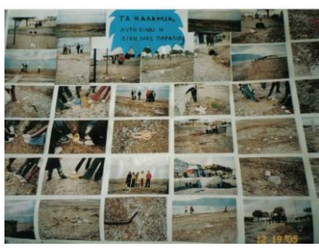
Η ακτή Καλάμια