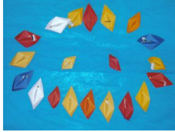
Τα κράτη της Μεσογείου