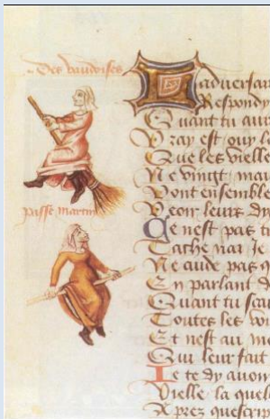
Εικόνα 2. Μάγισσες πάνω σε σκούπες. (Γαγανάκης, 2014, σ. 3)