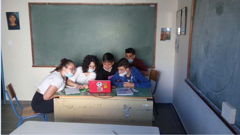
Εικόνα 8. Μαθήτριες και μαθητές έχουν πάρει το λάπτοπ και γράφουν όλες και όλοι μαζί χωρίς τη βοήθεια του καθηγητή. Δεν φαίνεται να τον χρειάζονται και πολύ πια. Αυτός είναι ο στόχος.